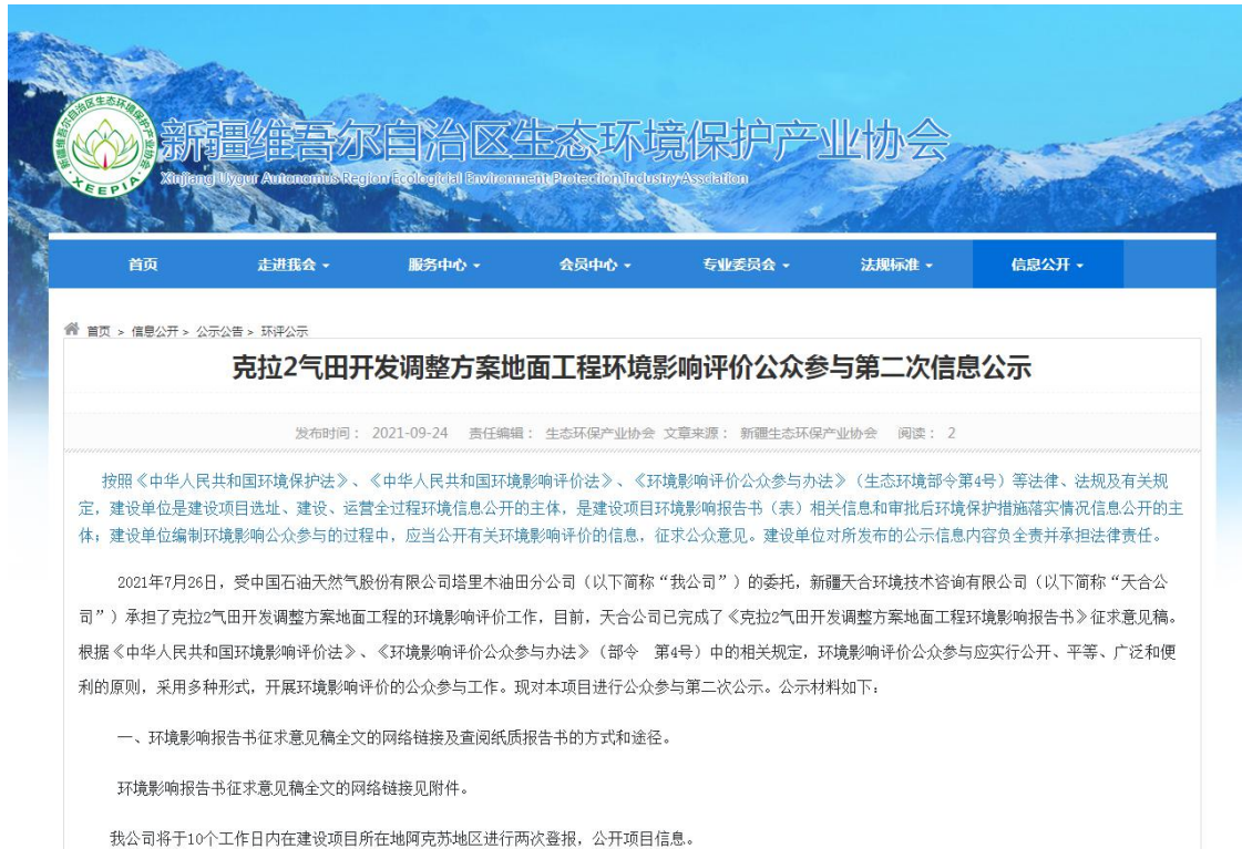
图2 本项目征求意见稿网络公示截图