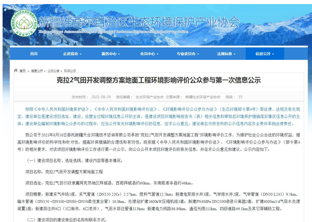
图1 本项目第一次网络公示截图