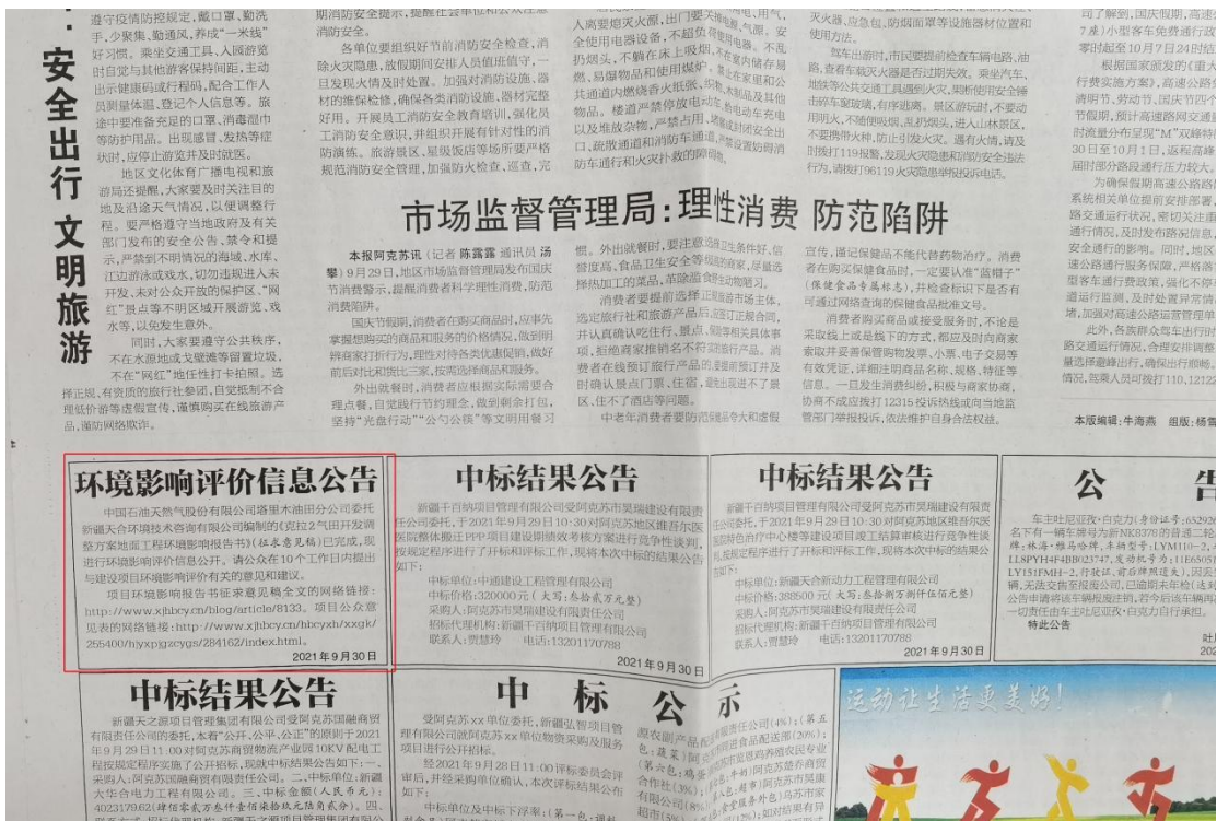
图4 本项目第二次报纸公示照片