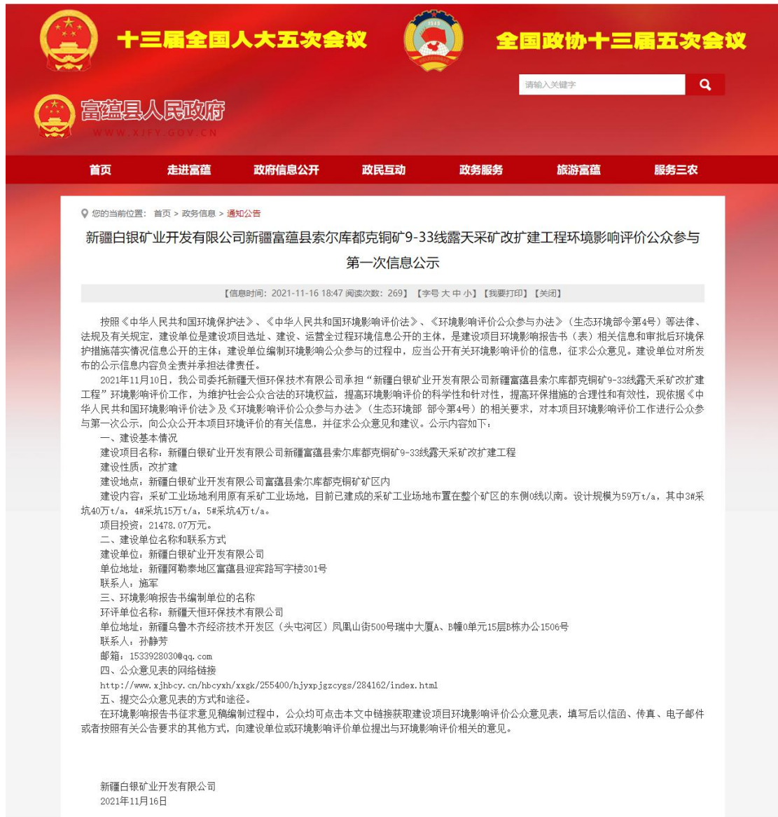
图 1 首次网络公示截图