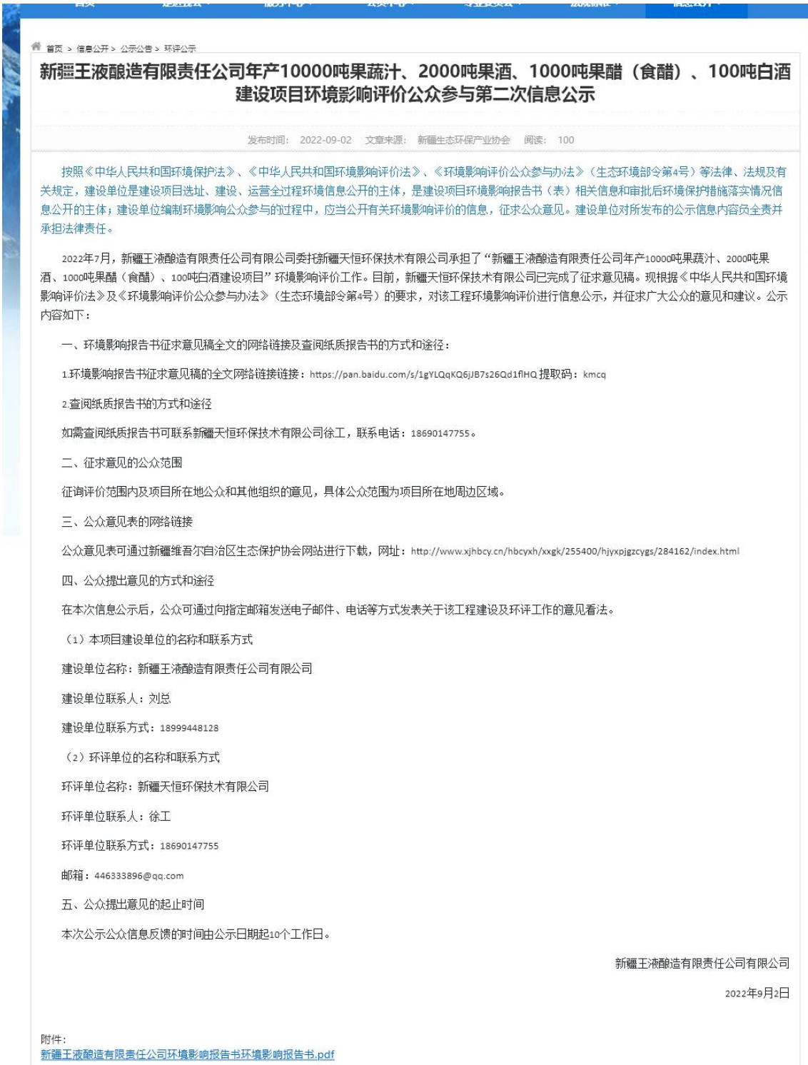
图 2 网上公示