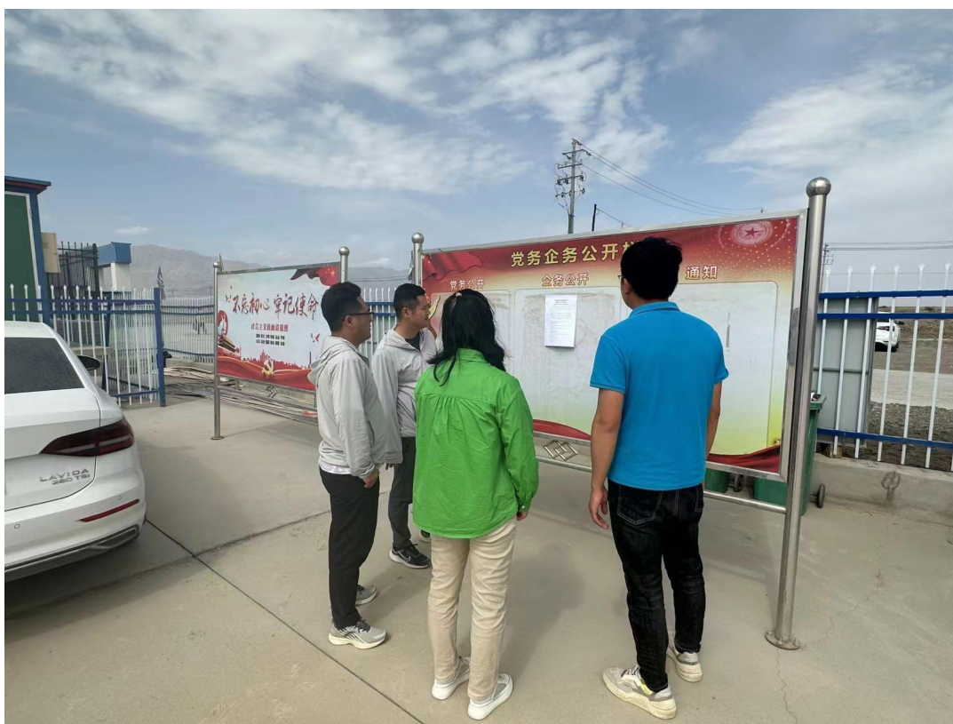
图 6 张贴照片