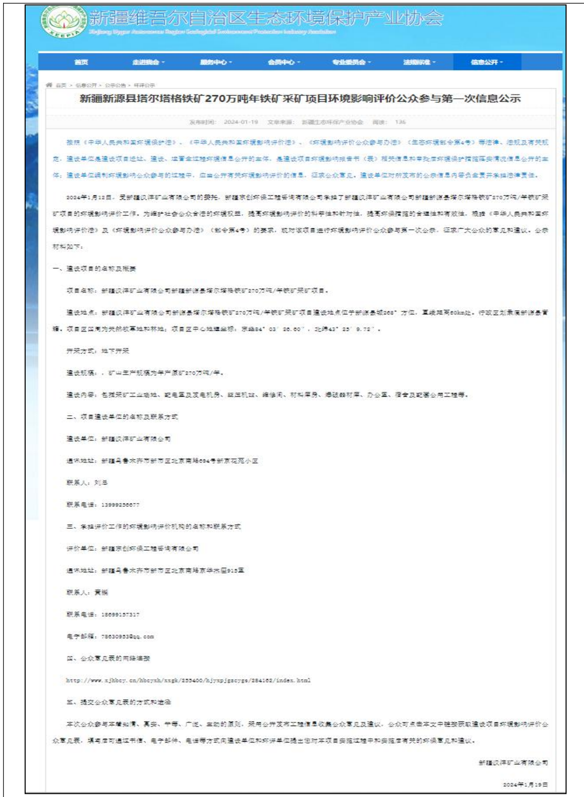
图 2.2-2 第一次信息公示