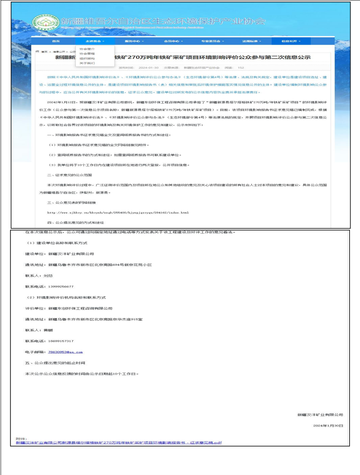
图 3.2-1 第二次公示（网络）