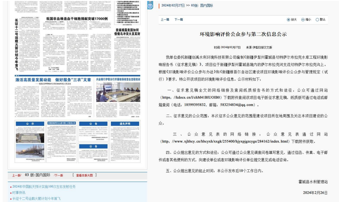
图3 2023年11月9日报纸公示

在网络公示的同时，我单位在伊犁日报（2024年2月27日和2024年2月29日）、发布了项目环境影响报告书公示信息，报纸公示照片件图3、图4。