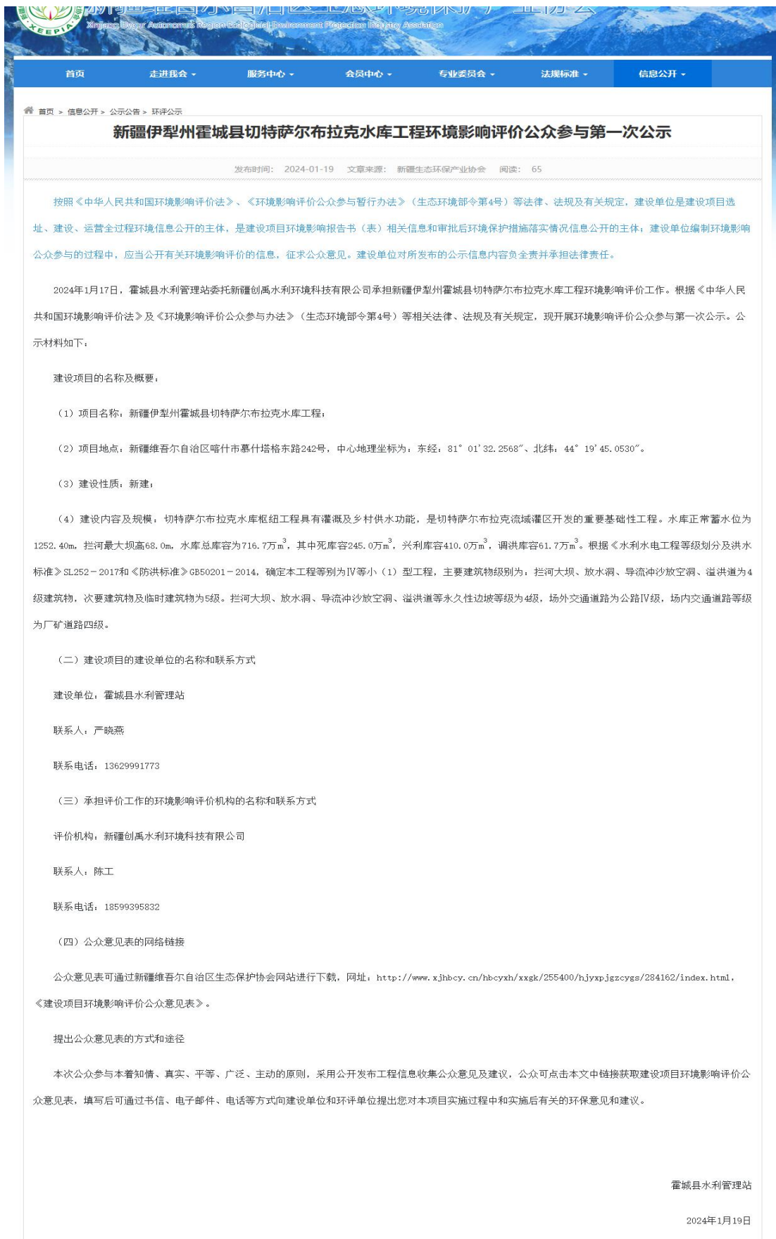
图 1 第一次网络公示截图