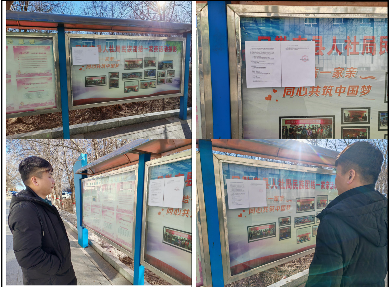
图 3.2-3 项目张贴公告照片

2024年3月15日，新疆润鑫西脉矿业投资有限公司在尼勒克县人民政府公告栏对该项目征求意见稿进行了张贴公告，并收集建设项目环境影响评价公众参与表，公示时限为2024年3月15日~3月28日，共10个工作日。张贴公告照片见图3.2-3。