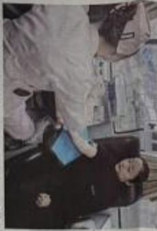
1月18日，尼勒克县公安局交警大队民警正在为群众提供咨询服务。

“雷锋精神”是社会主义核心价值体系的重要组成部分，也是中华民族的传统美德。在新时代的征程上，雷锋精神依然具有重要的现实意义。尼勒克县公安局交警大队的民警们，用实际行动诠释了雷锋精神的真谛。他们爱岗敬业、无私奉献，在平凡的岗位上做出了不平凡的业绩。无论是严寒酷暑，还是狂风暴雨，他们总是第一时间出现在一线，为人民群众排忧解难。他们的先进事迹，在警营里闪闪发光，成为广大民警学习的楷模。