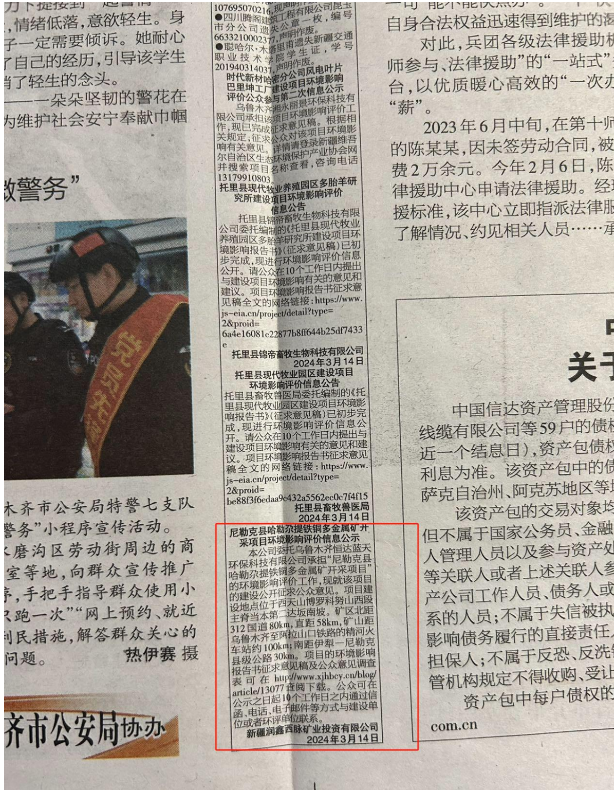
图 3.2-1 项目 3 月 14 日征求意见稿报纸信息公示截图