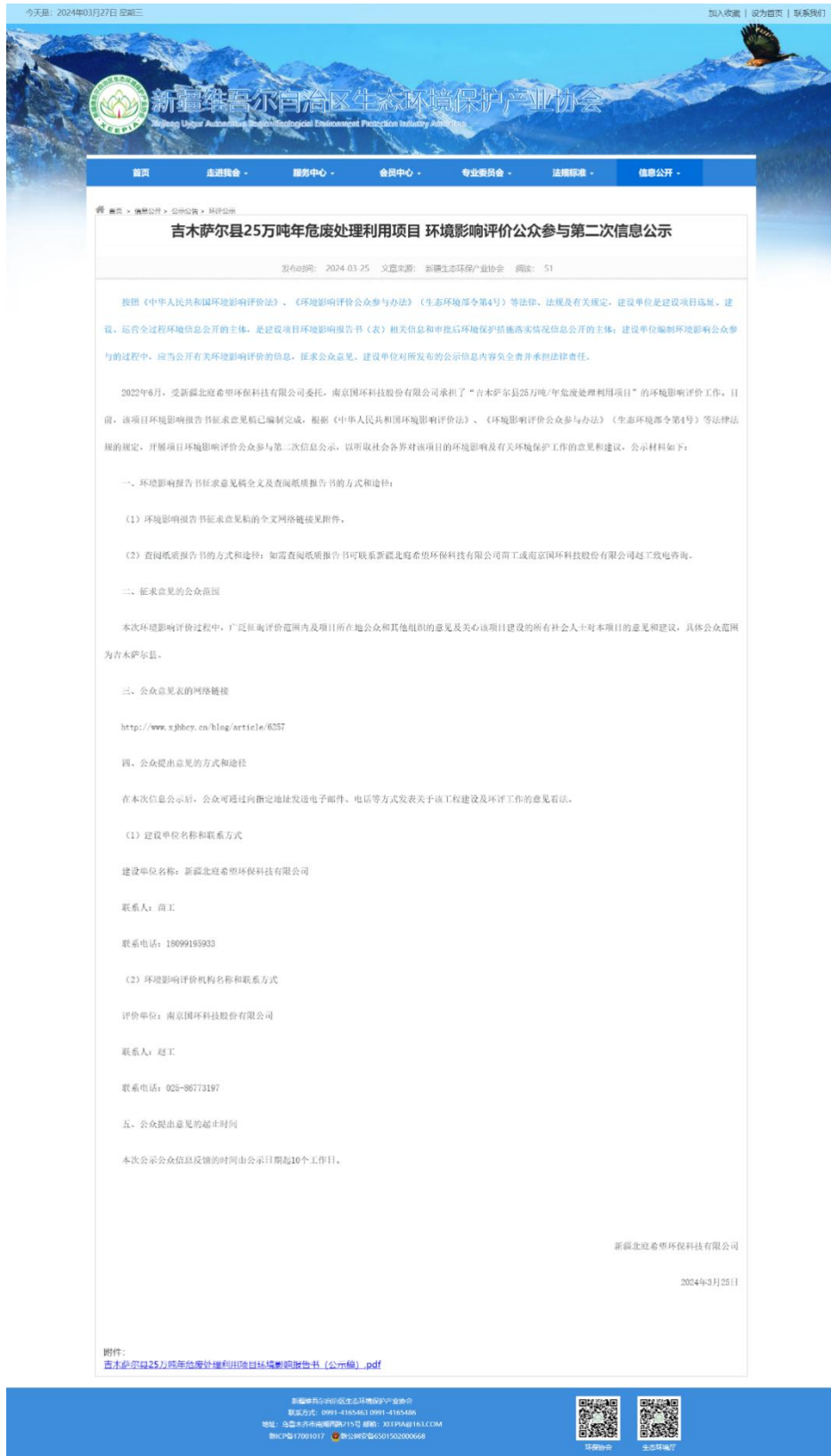
图3-1 征求意见稿公示截图