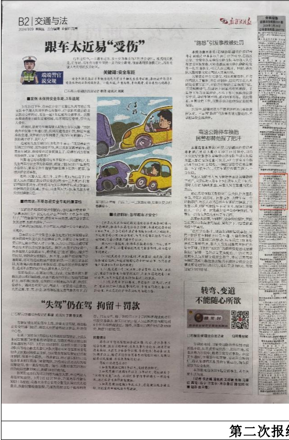
第一次报纸公示照片