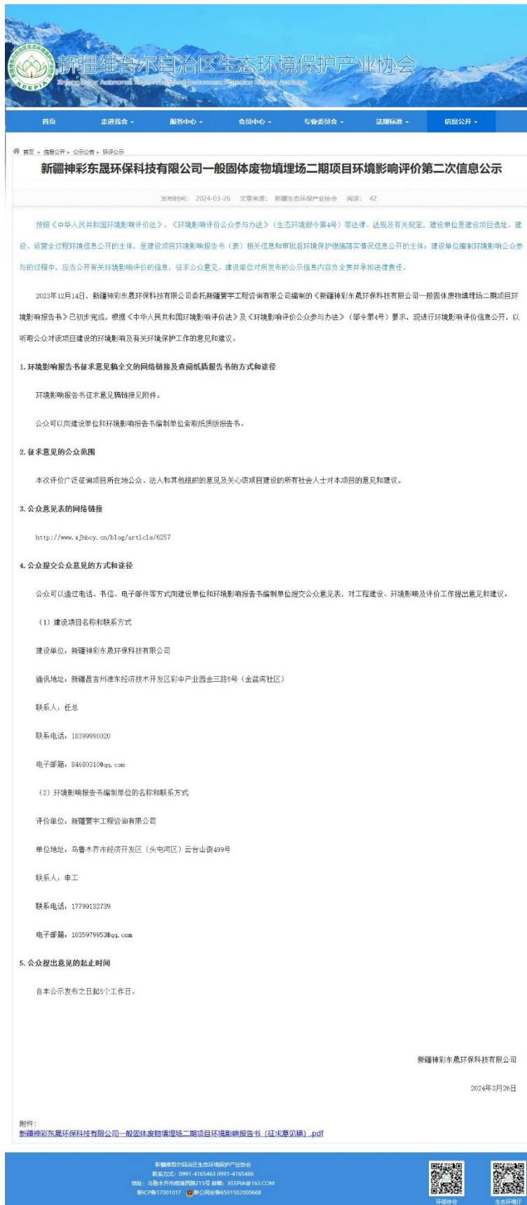
图 1 征求意见稿网络公示截图