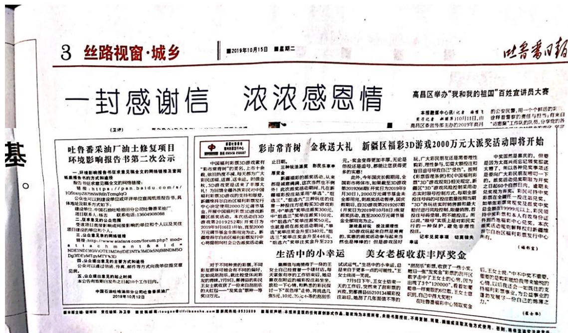
图 3-2 第一次报纸公示图