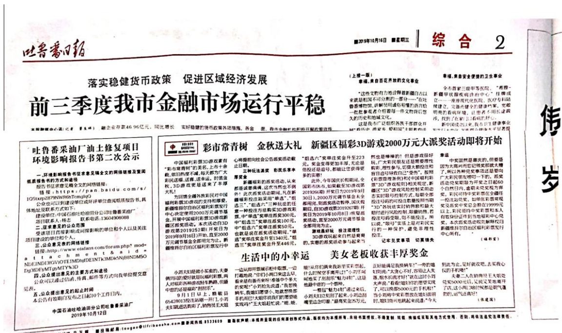
图3-3 第二次报纸公示图