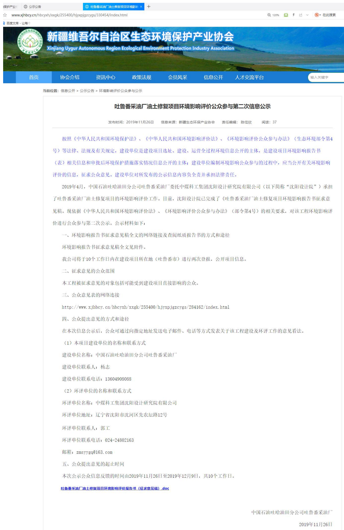
图3-1 网络平台公示图