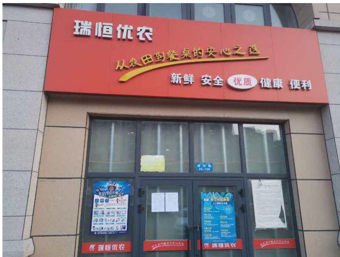
图 3.2-4 张贴（一）

征求意见稿在信息公开期间，选取了克拉玛依市瑞恒销售点，将征求意见稿信息公开内容进行了张贴。张贴日期为 2020 年 1 月 7 日~1 月 20 日。