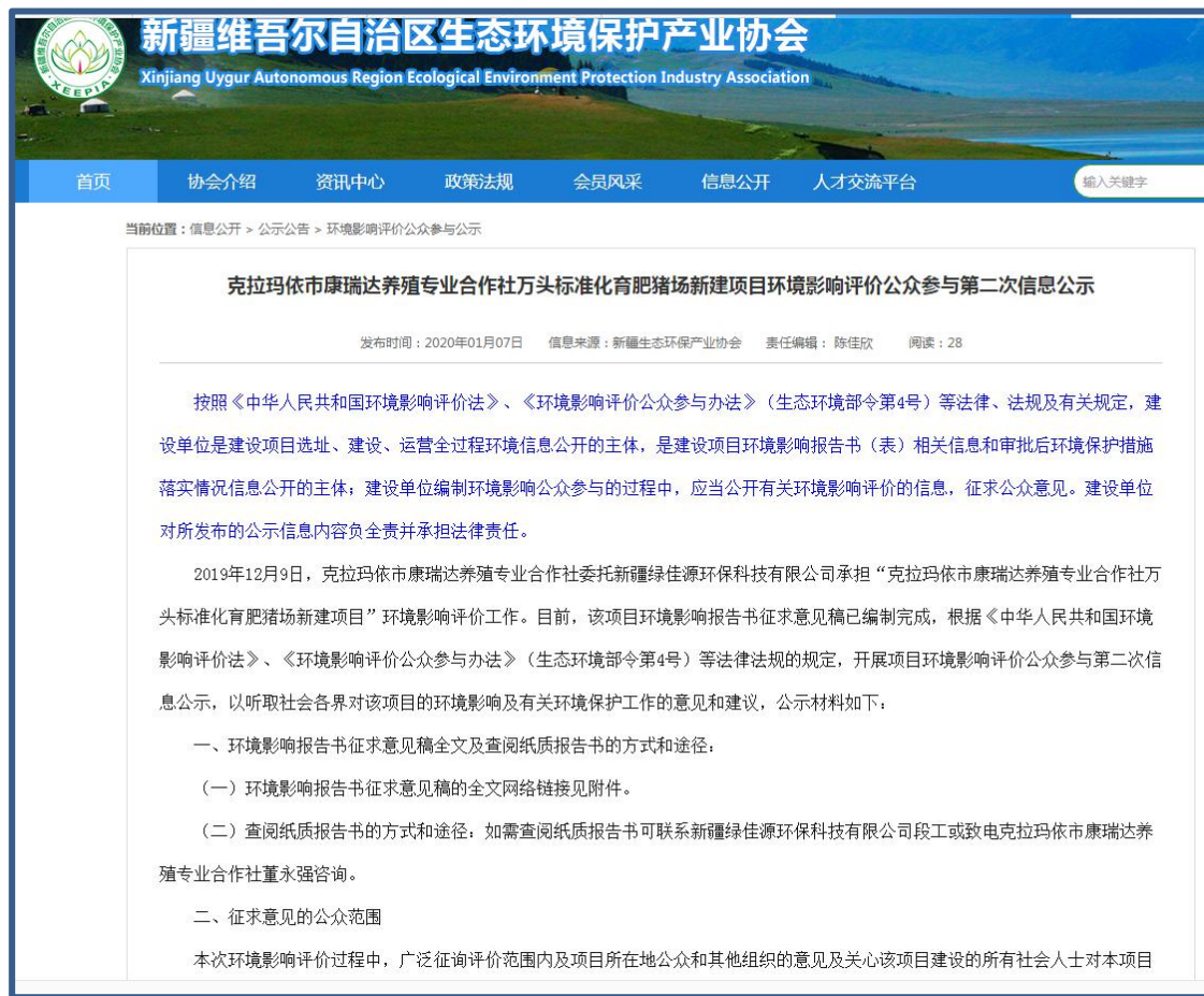
图 3.2-1 第二次公示图片