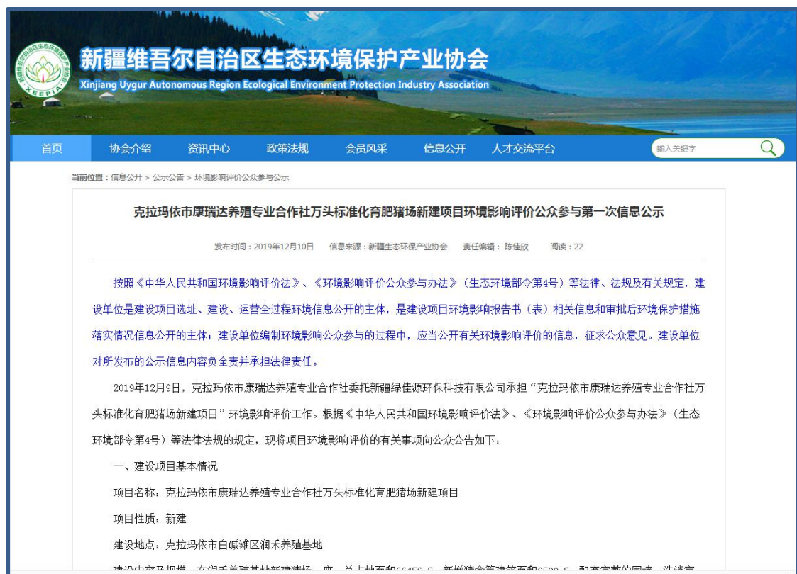
图 2.2-1 第一次公示截图图片