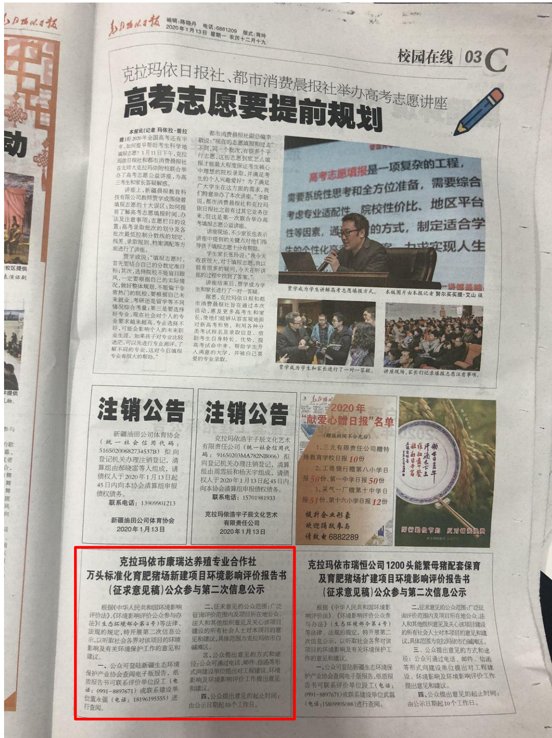
图 3.2-3 报纸信息公开（二）

《克拉玛依日报》作为项目所在地公众易于接触的报纸公开，且在征求意见的 10 个工作日内公开信息为 2 次。