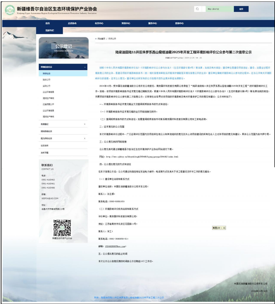
图 3.2-1 环境影响评价第二次公示（新疆维吾尔自治区生态环境保护产业协会网站）