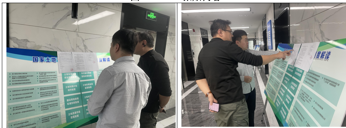
图 3.2-5 公告照片