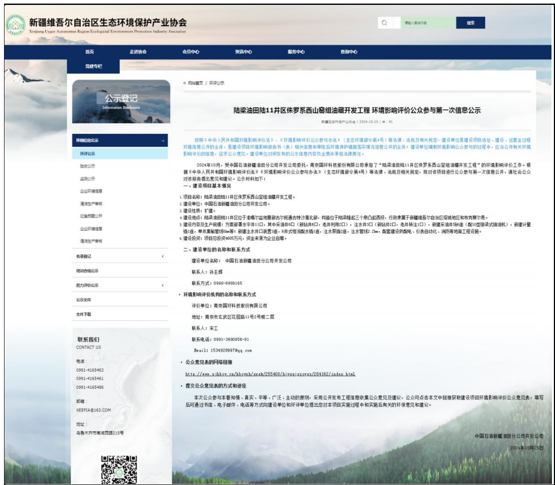
图 2-1 环境影响评价第一次公示网页截图