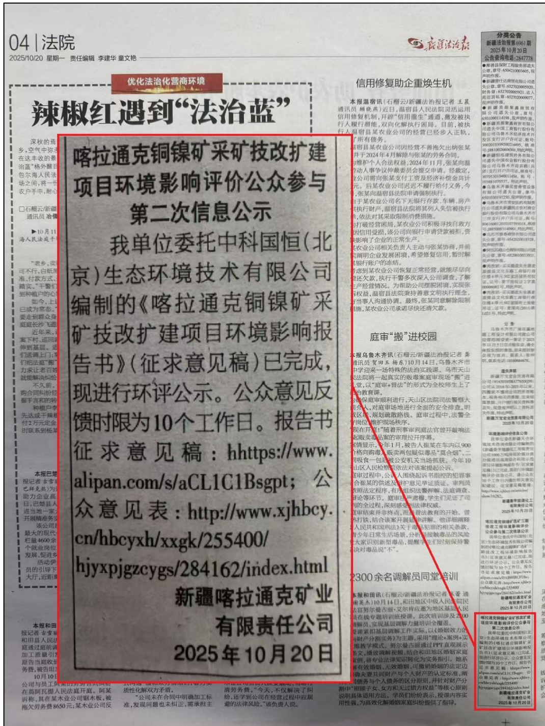
图 3 本项目第一次报纸公示照片