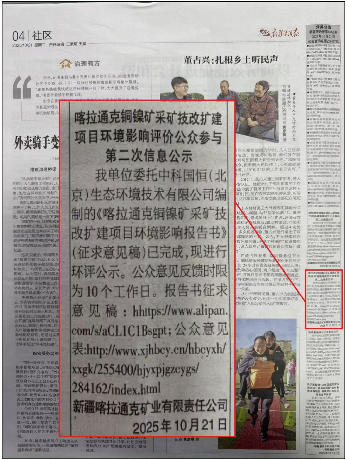
图 4 本项目第二次报纸公示照片