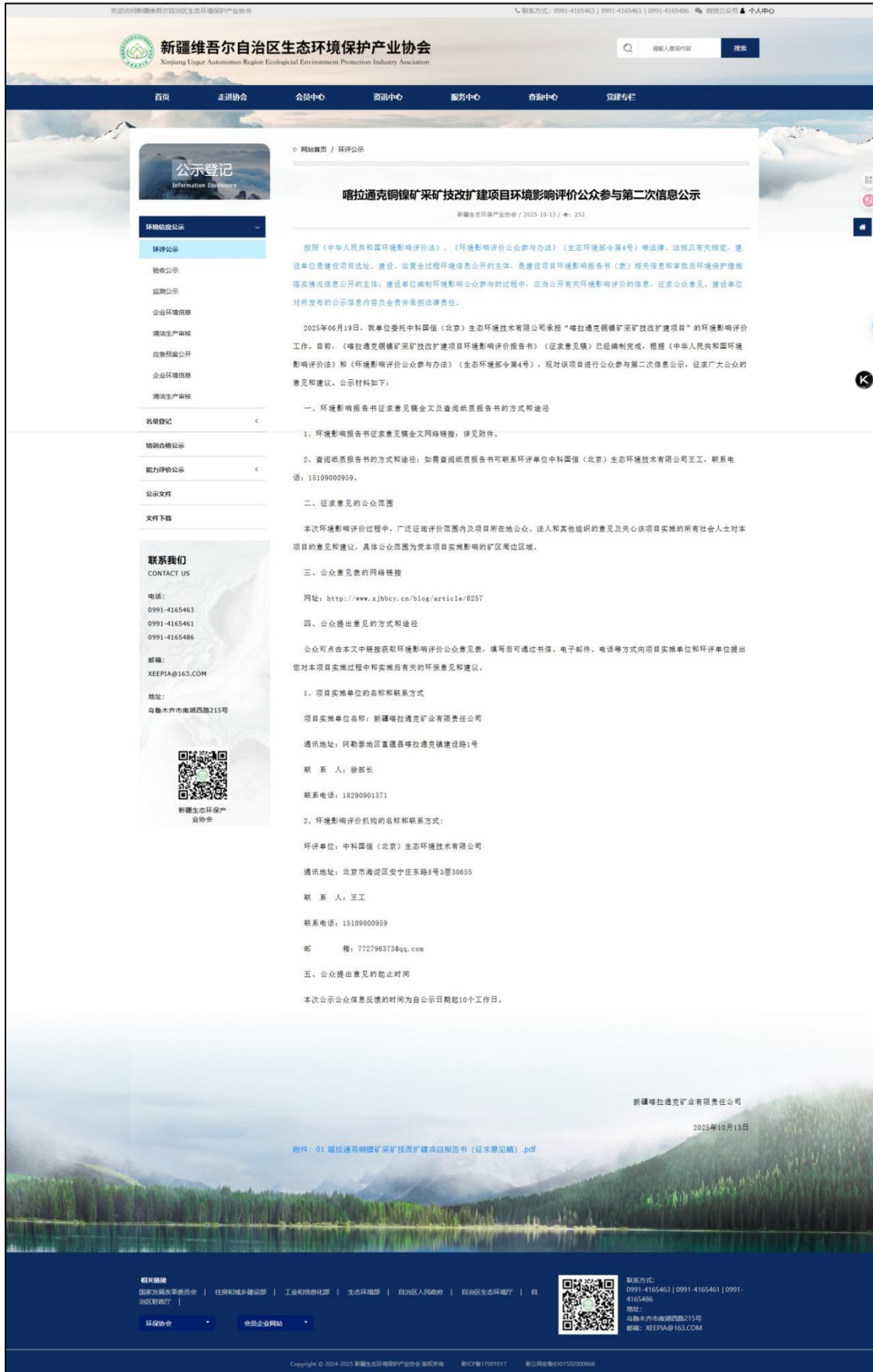
图 2 本项目征求意见稿网络公示截图