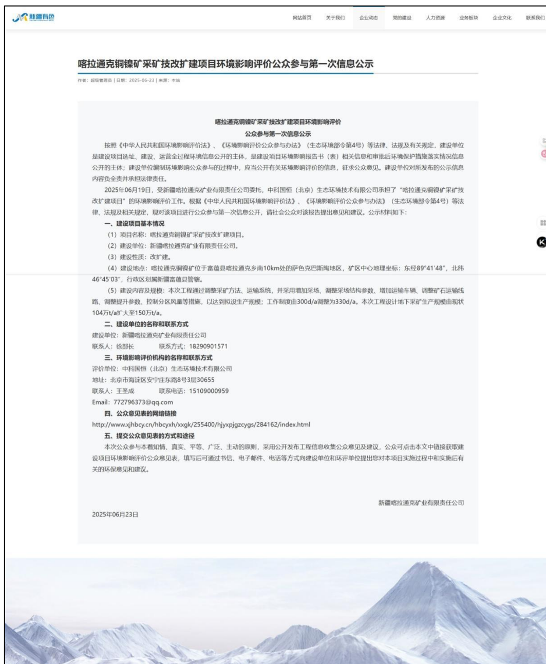
图1 本项目第一次网络公示截图