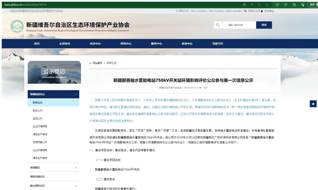
图 1 第一次公众参与网络公示截图

网进行第一次信息公开（公示网址为： http://www.xjhbcy.cn/articles/show/16316 ），网站公示截图见图 1。