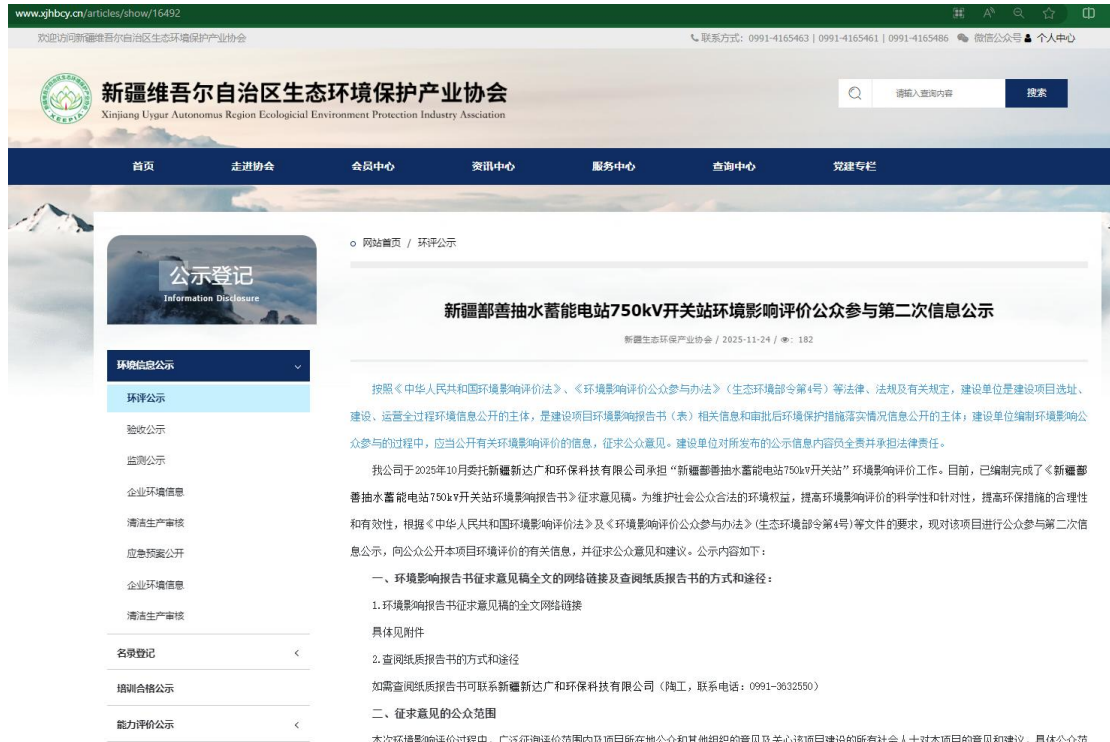
图 2 征求意见稿网上公示截图