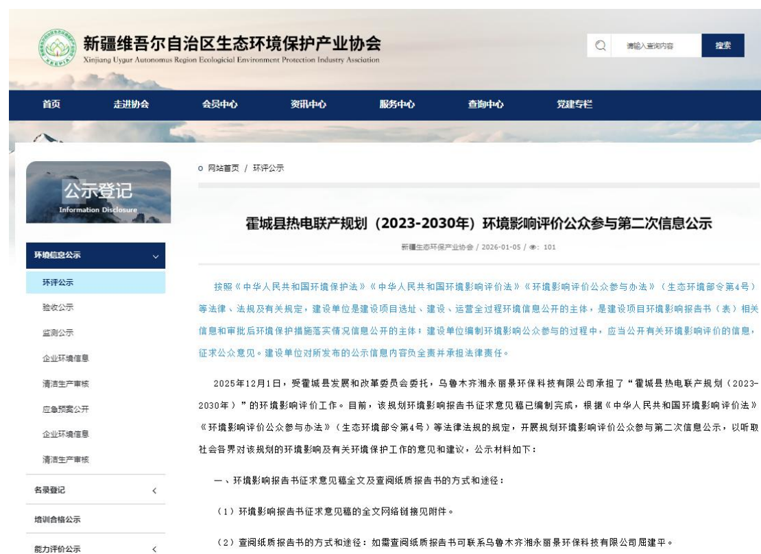
图2 本次规划环评征求意见稿网络公示截图