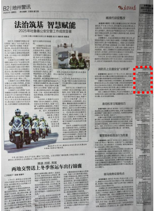
图 4 本规划环评第二次报纸公示照片