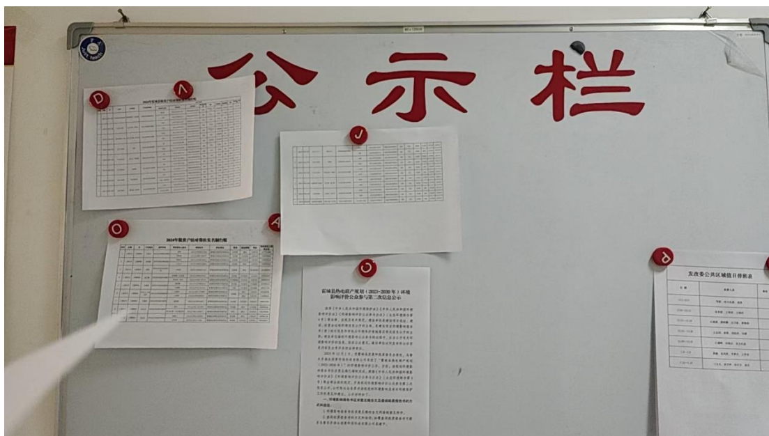
图 5 公示现场照片