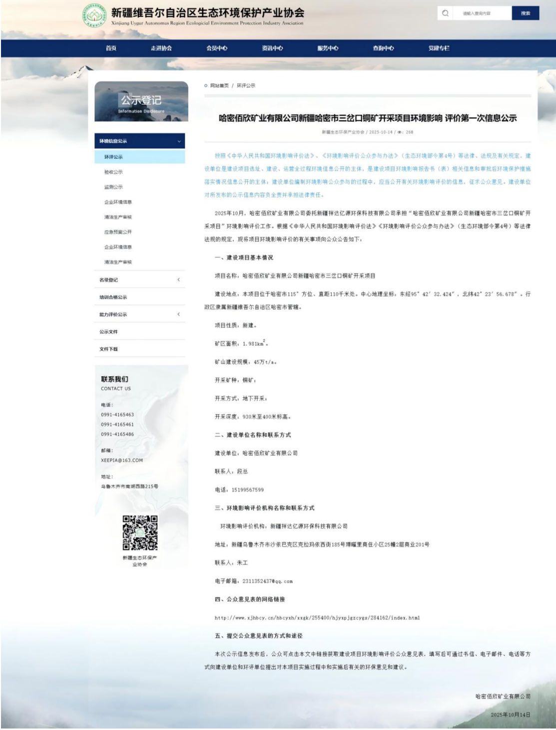
图2-1 第一次信息公示（新疆维吾尔自治区生态环境保护产业协会网站）