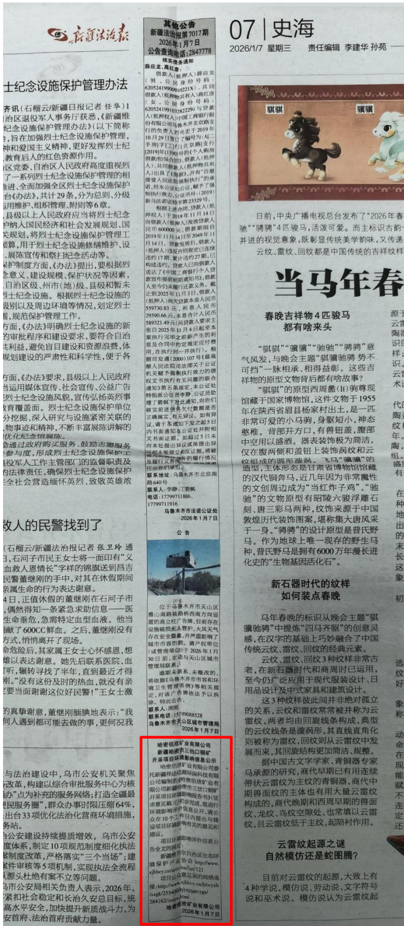
图3-2 第二次公示一征求意见稿报纸发布（2026年1月7日）