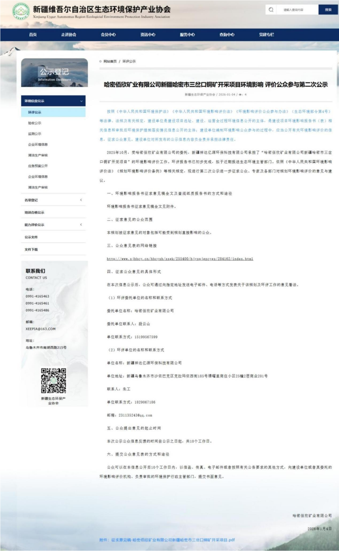
图3-1 第二次公示征求意见稿网络公示图