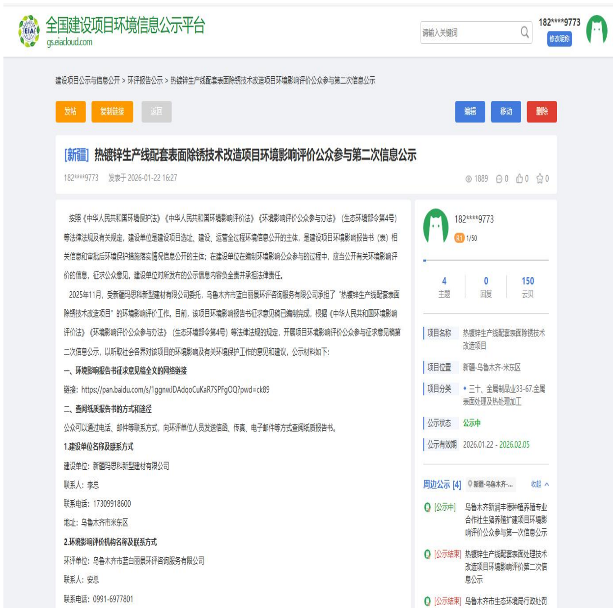
图 1-1 第二次网络公示截图