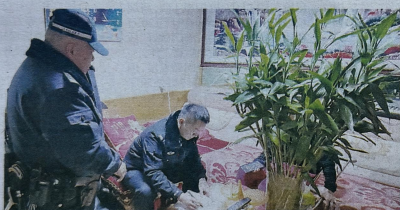
1月15日，乌鲁木齐市沙依巴克区人民法院执行局向被执行人家属介绍案件情况。

本报乌鲁木齐讯（石榴云/新疆法治报记者 古雪丽 通讯员 孟庆）1月15日20时30分，乌鲁木齐市沙依巴克区人民法院执行局办公楼灯火通明。“出发，一声有力的指令下，数辆警车依次驶出，一场针对被执行人被拘传的集中拘传行动正式启动。 此次行动特邀新市区人民检察院检察全程监督，以确保执行程序合法、规范、透明。