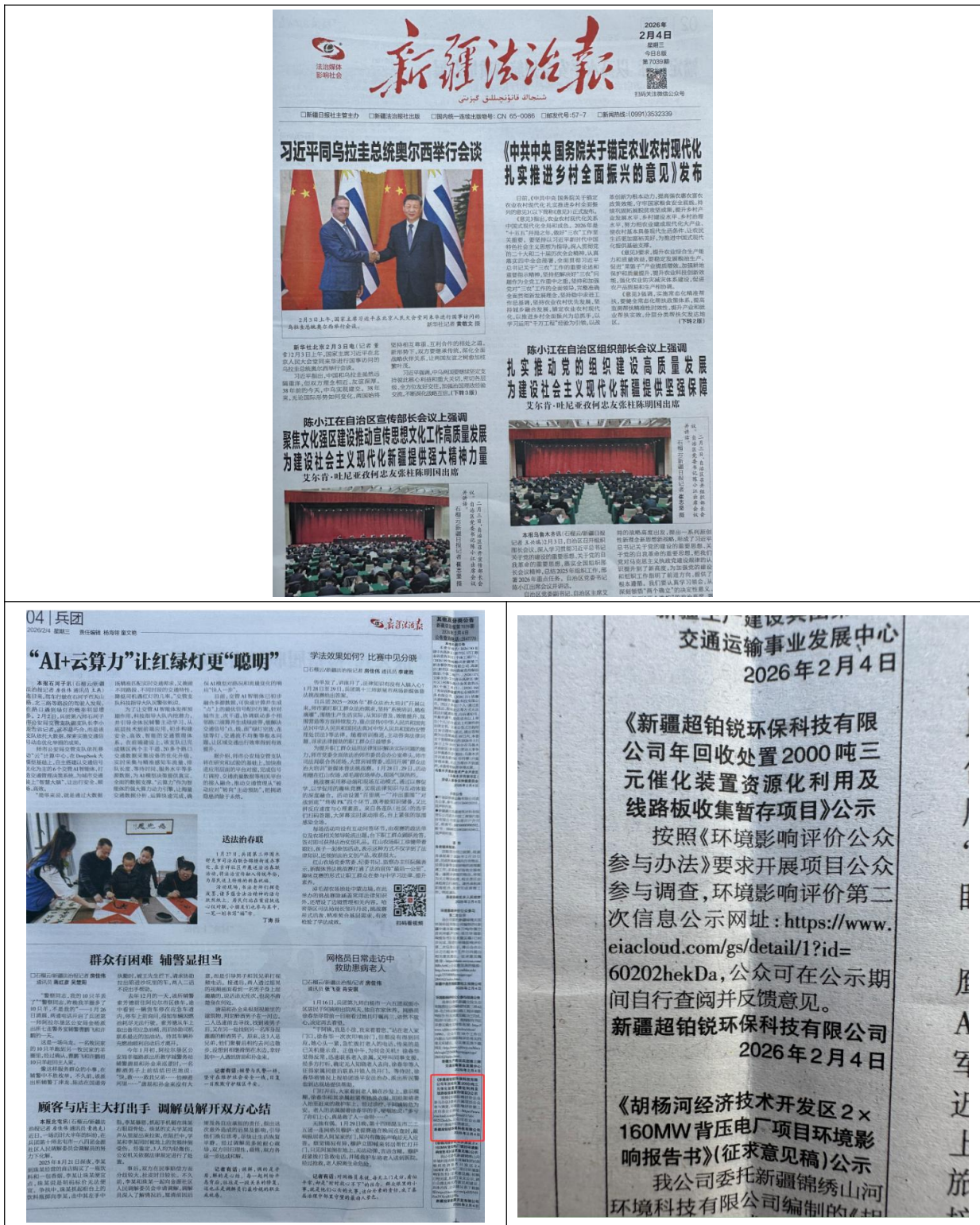
图 1.4-2 征求意见稿全文第一次报纸公示图片（节选）

在网站公示期间，建设单位分别于2026年2月4日和2月5日在《新疆法治报》上刊登了本项目的公示材料，新疆法治报是当地的主力媒体，拥有较大影响力。公示的具体情况见下图。