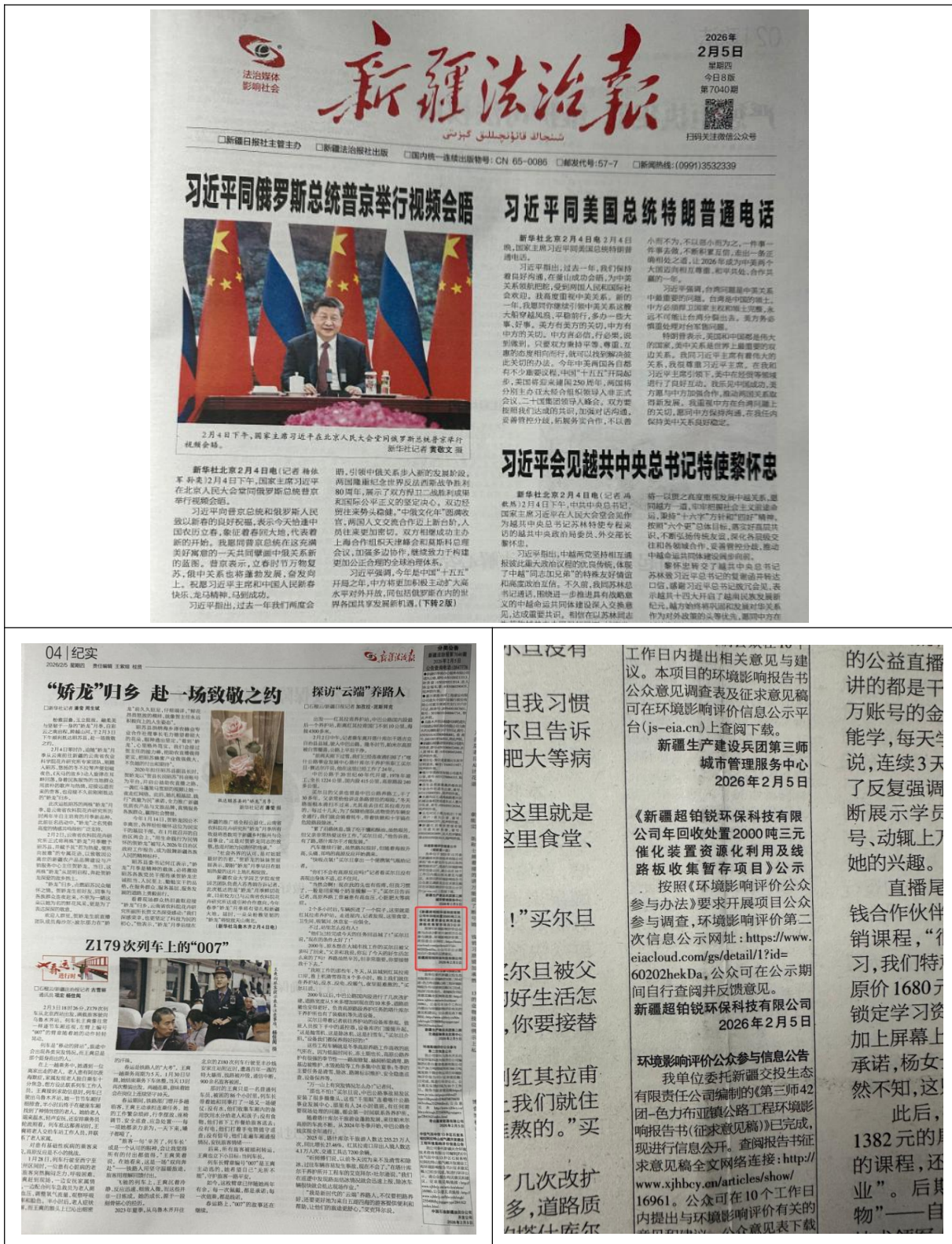
图 1.4-3 征求意见稿全文第二次报纸公示图片（节选）