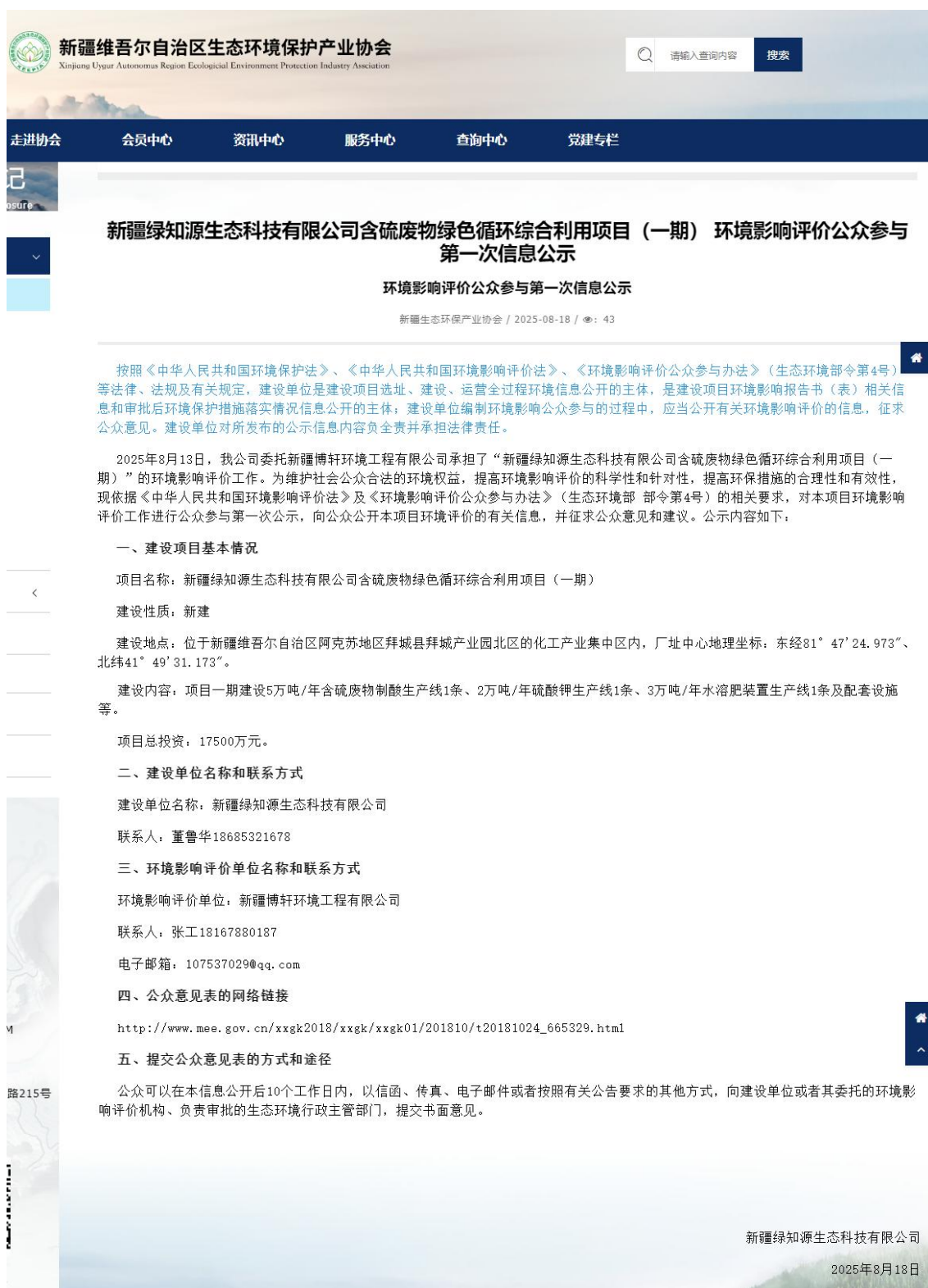
图1 首次网络公示信息截图