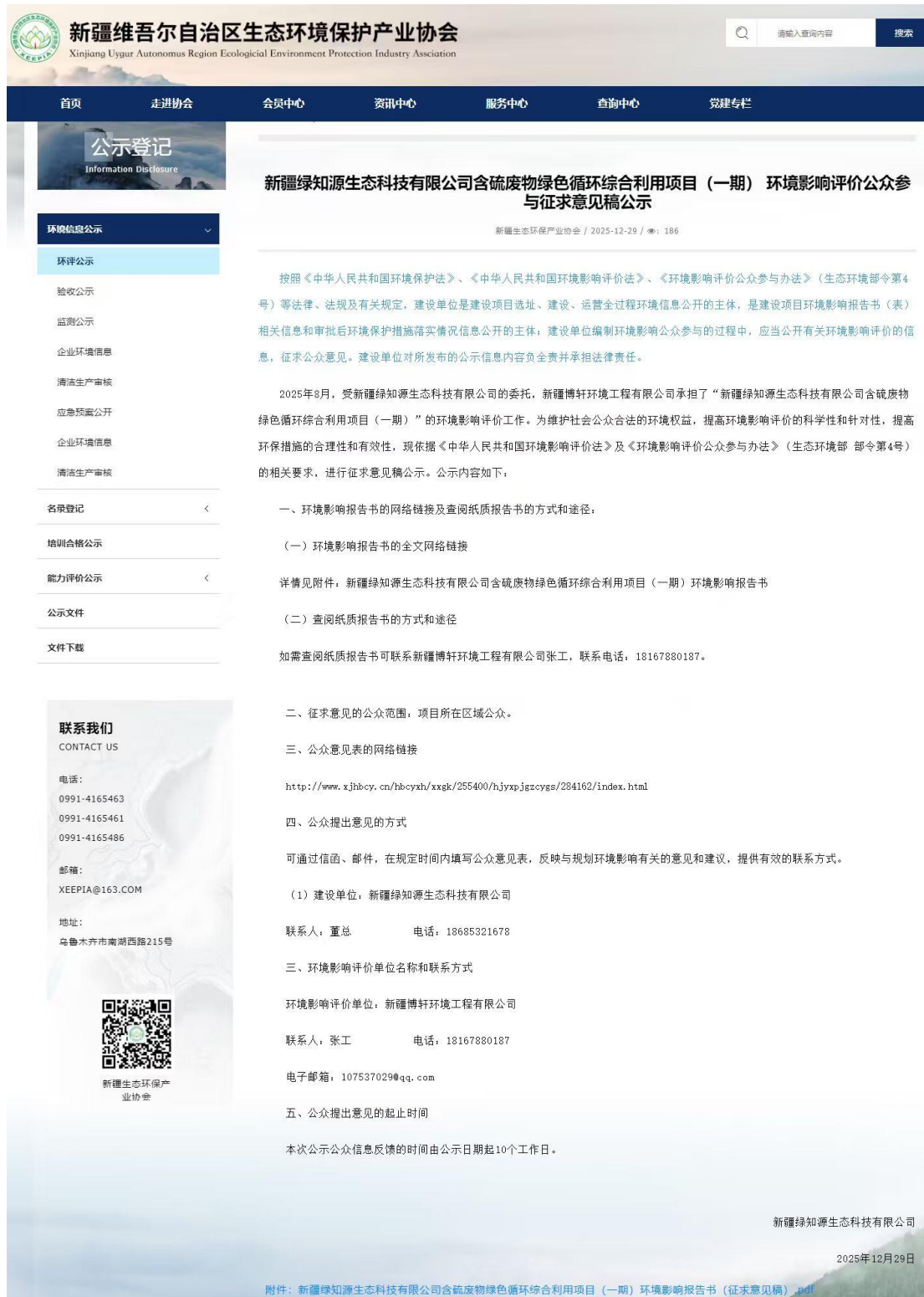
图 2 网络公示截图