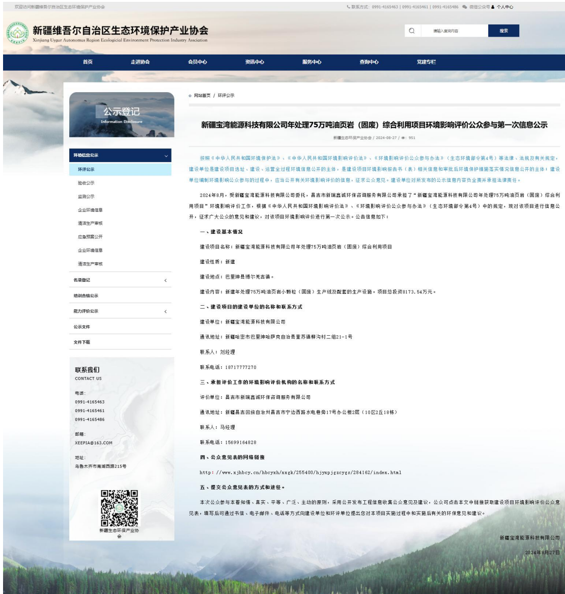
图 1 第一次网络公示截图