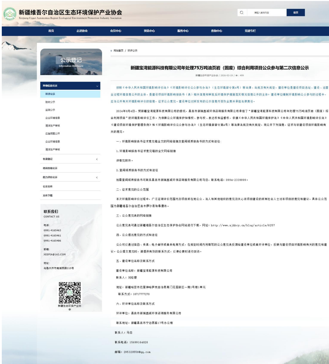
图2 本项目征求意见稿网络公示截图