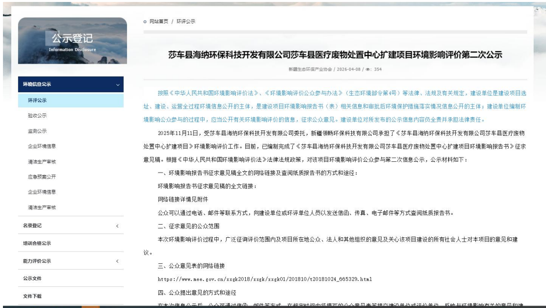
图 3.2-1 征求意见稿网上公示