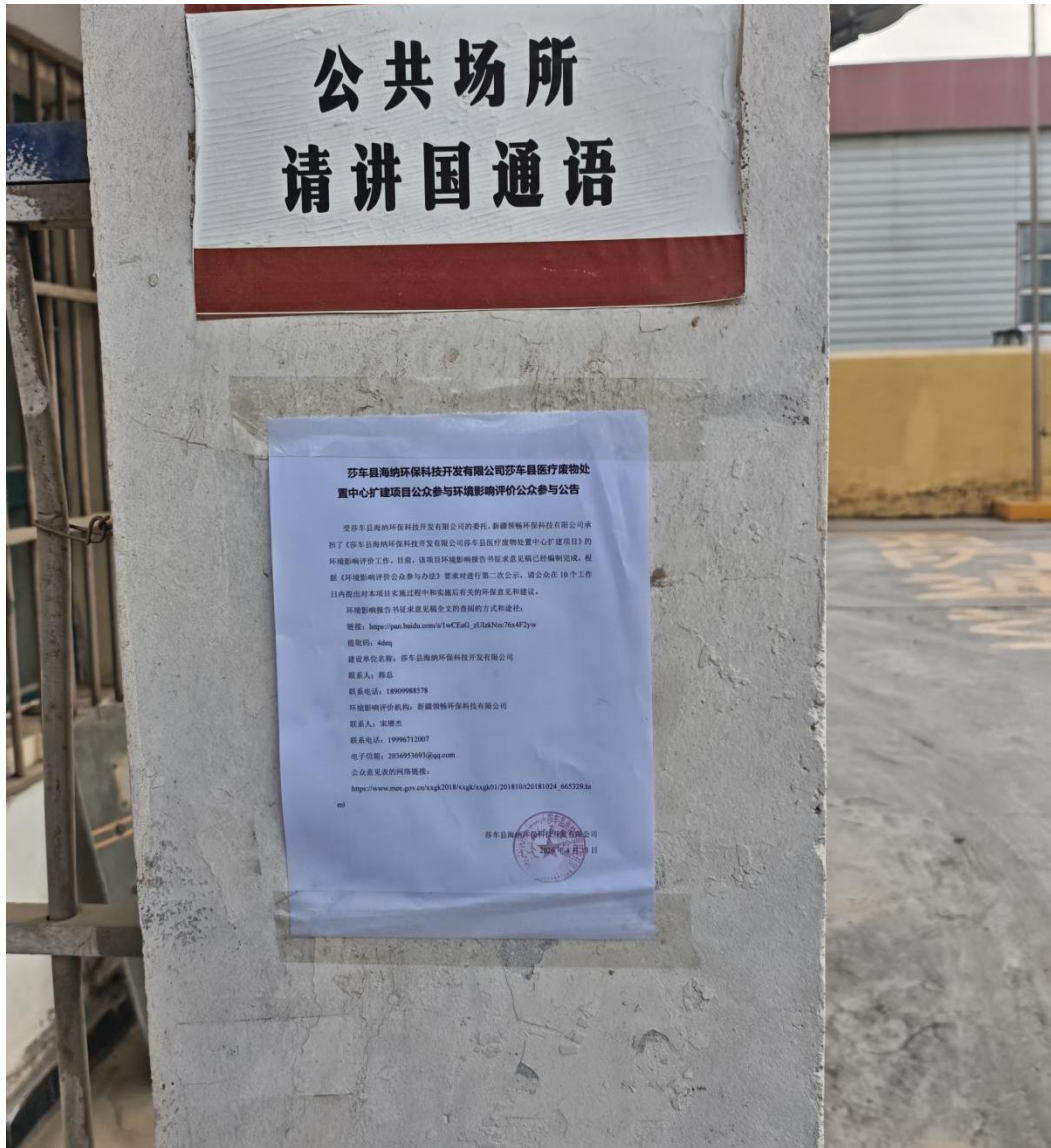
图 3.2-4 张贴公告