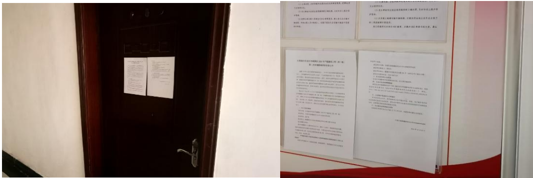
图 3 环境影响评价第二次信息张贴公示

张贴区域选取的符合性分析:本项目周边5km内无居民区等保护目标,征求意见稿公示选取本项目建设单位作为张贴区域,连续公示10个工作日,符合《环境影响评价公众参与办法》要求:“通过在建设项目沿线公众易于知悉的场所张贴公告的方式公开,且持续公开期限不得少于10个工作日”。张贴公示照片见图3。