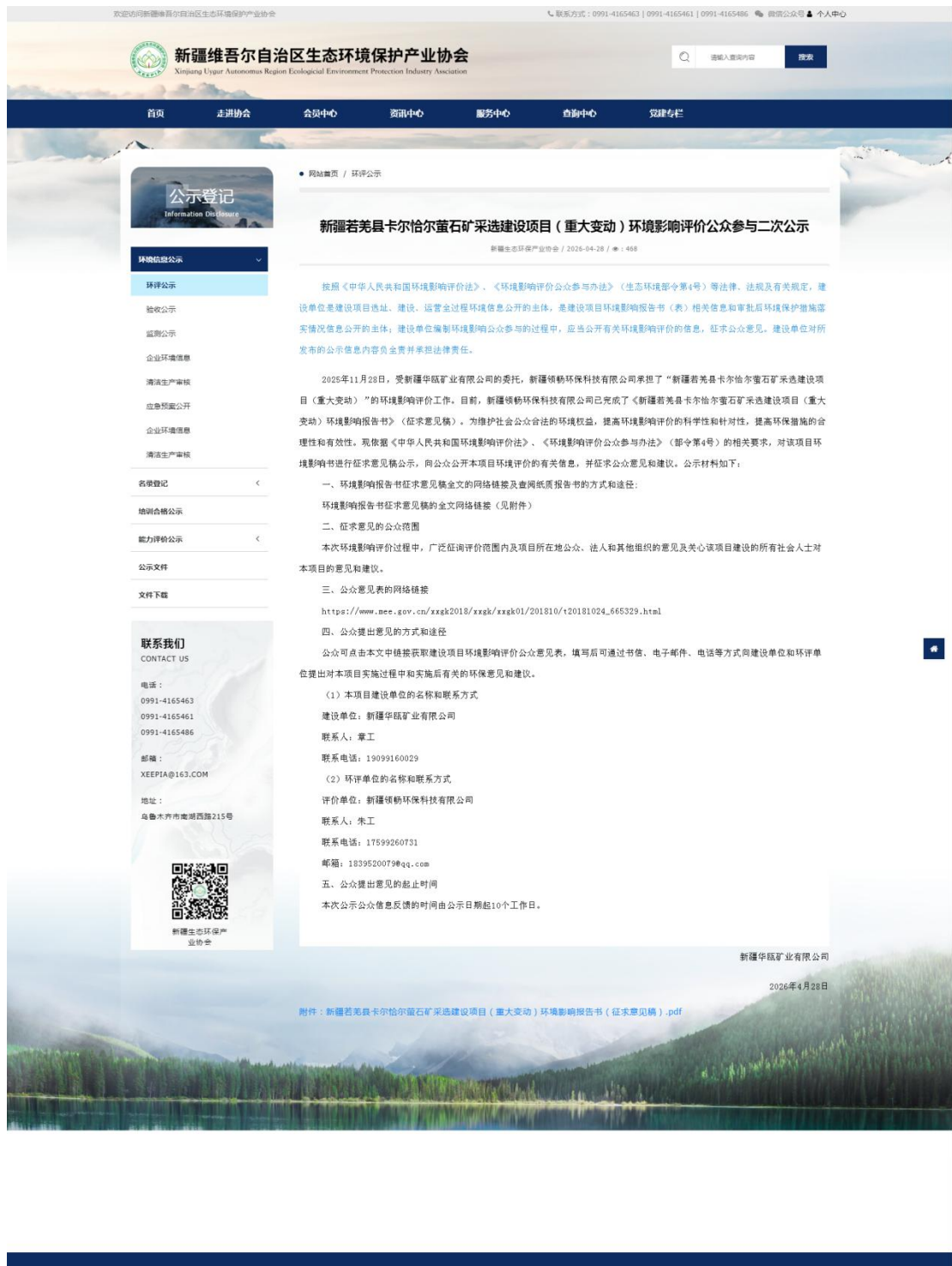
图 3.2-1 征求意见稿网上公示