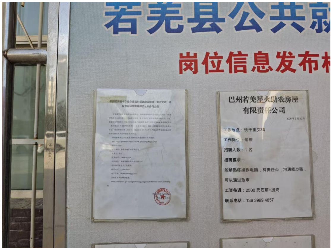
图 3.2-4 张贴公告