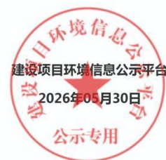
图 2.2-1 第一次公示截图