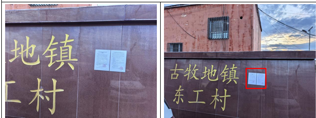
东工村现场张贴照