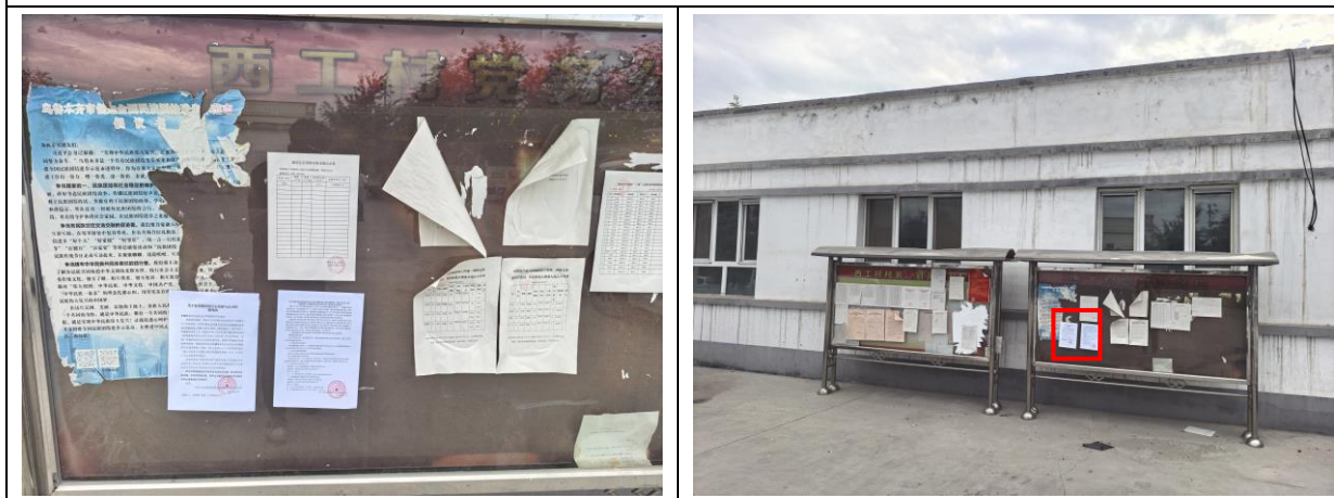
西工村现场张贴照