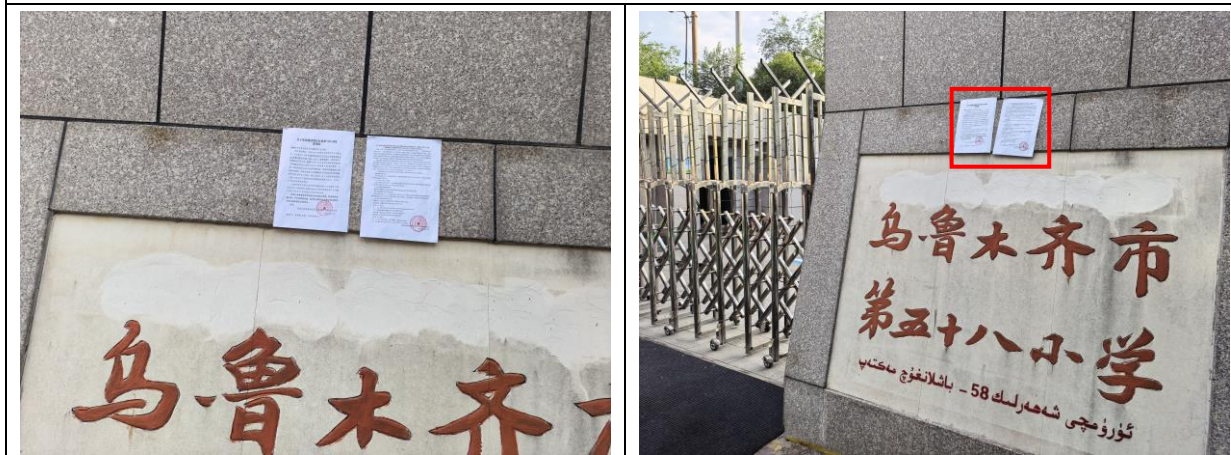
乌鲁木齐市第五十八小学现场张贴照