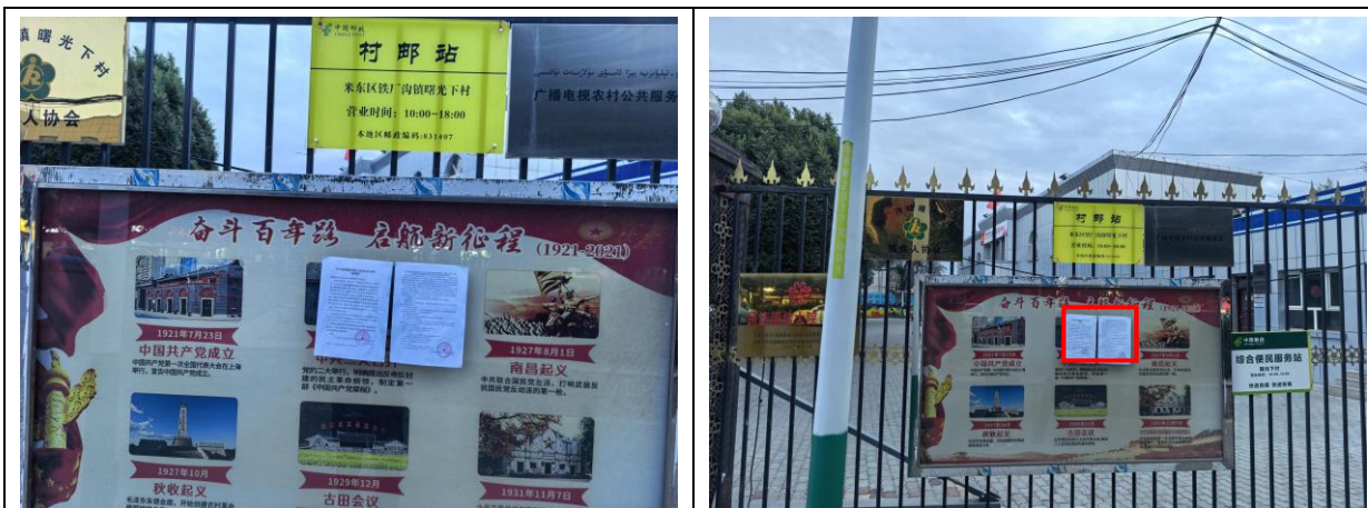
曙光下村现场张贴照