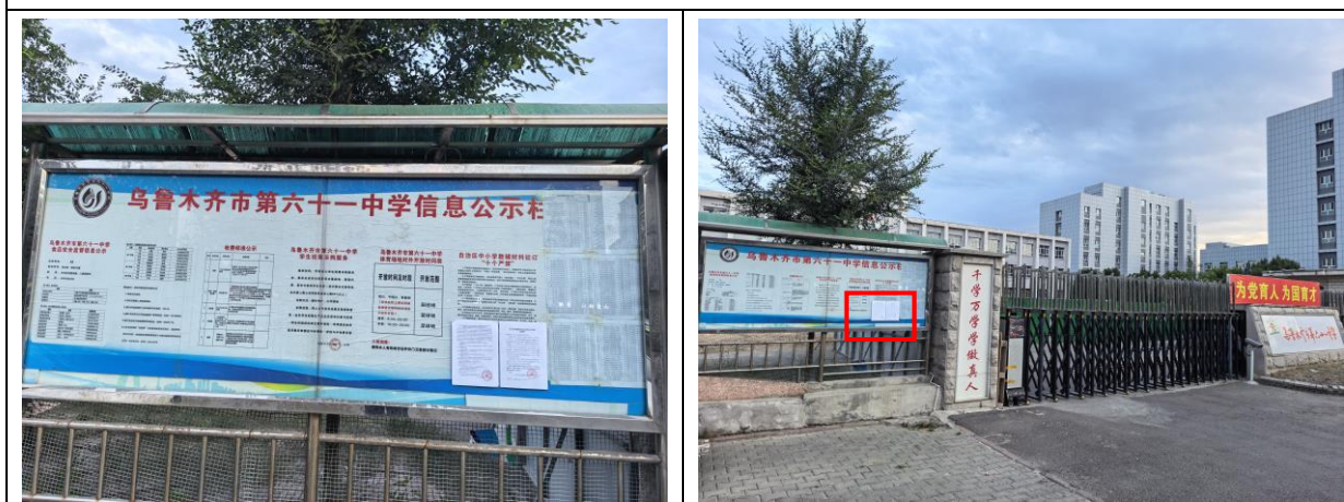
乌鲁木齐市第六十一中学现场张贴照