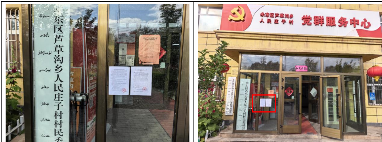
人民庄子村现场张贴照