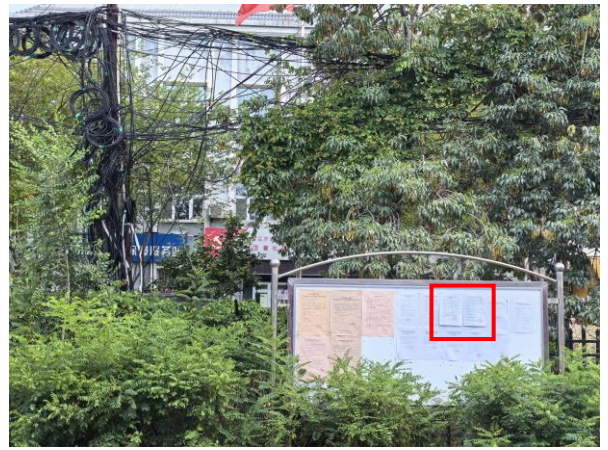
金戈壁社区现场张贴照