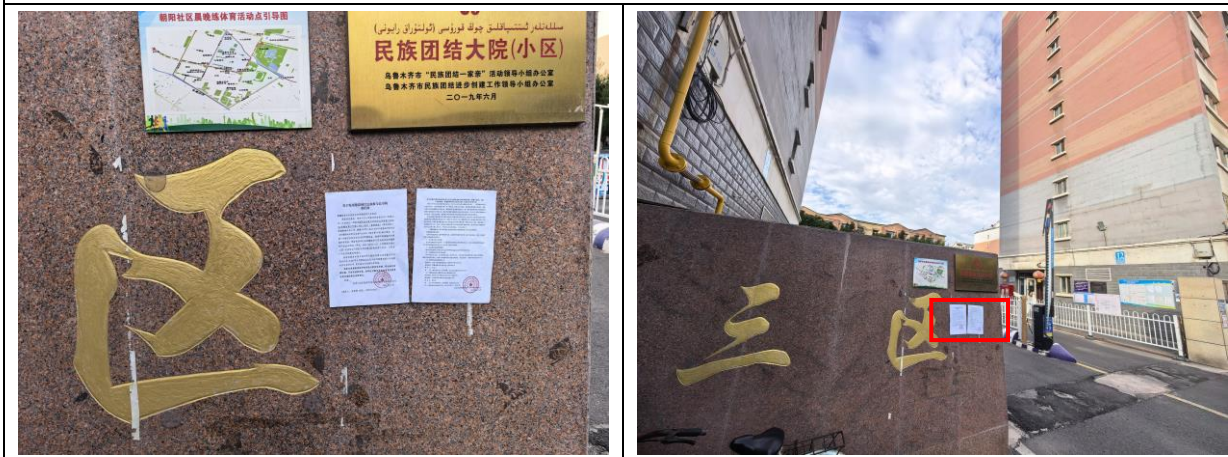
石化生活区现场张贴照