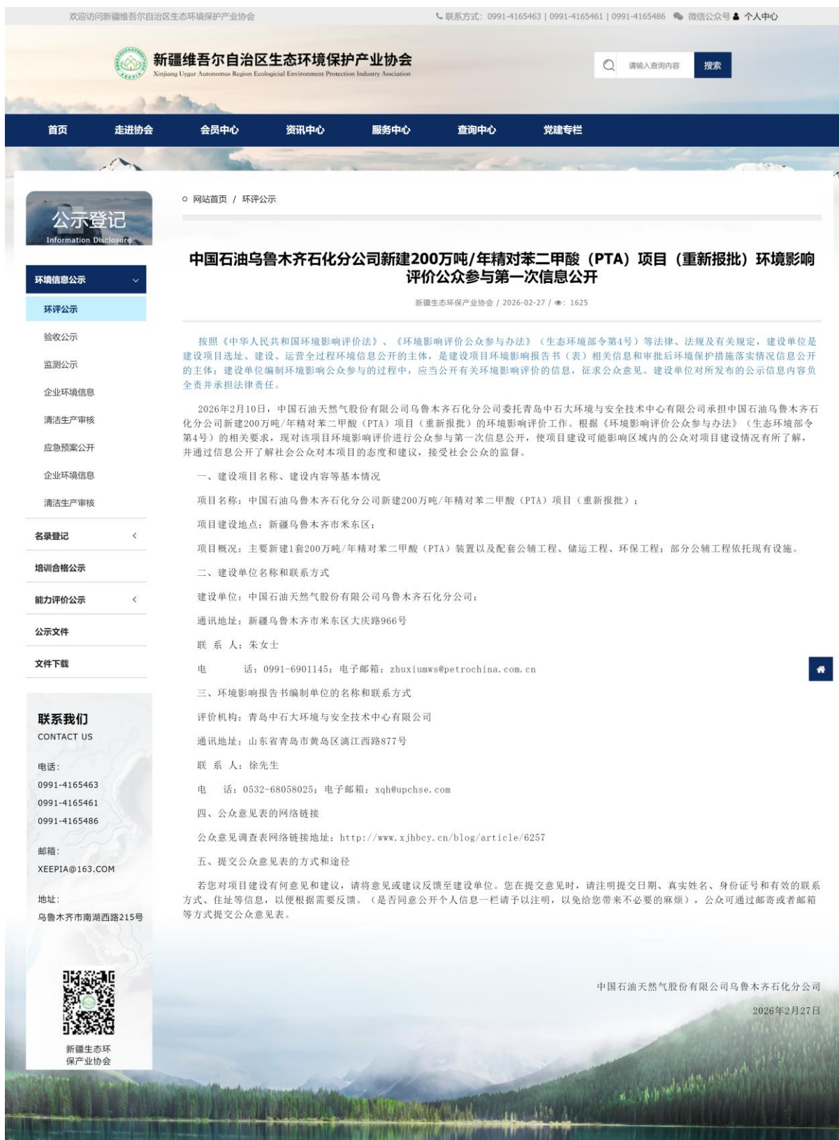
图 2-1 本项目环评首次信息公开在新疆维吾尔自治区生态环境保护产业协会网站截图