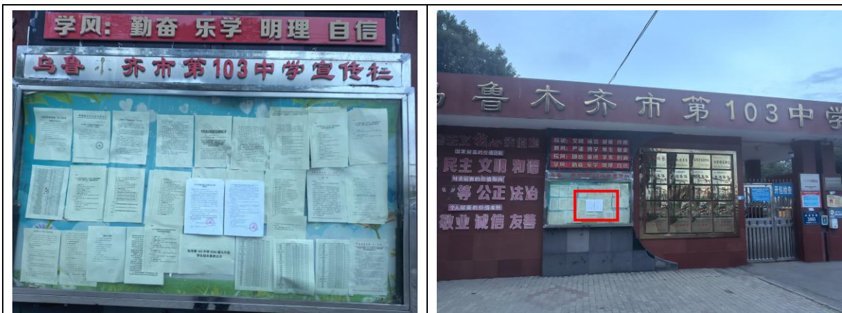
乌鲁木齐市第 103 中学现场张贴照