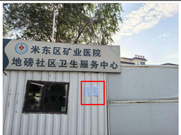
米东区矿业医院现场张贴照