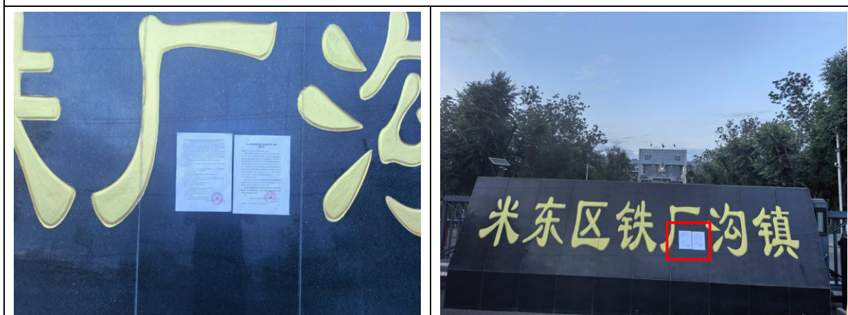
米东区铁厂沟镇政府现场张贴照