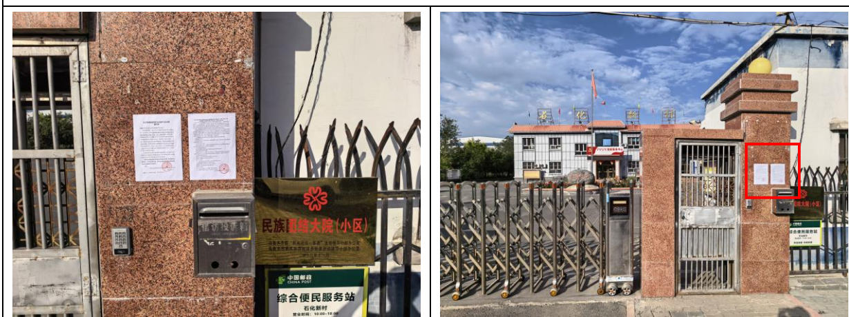
石化新村现场张贴照