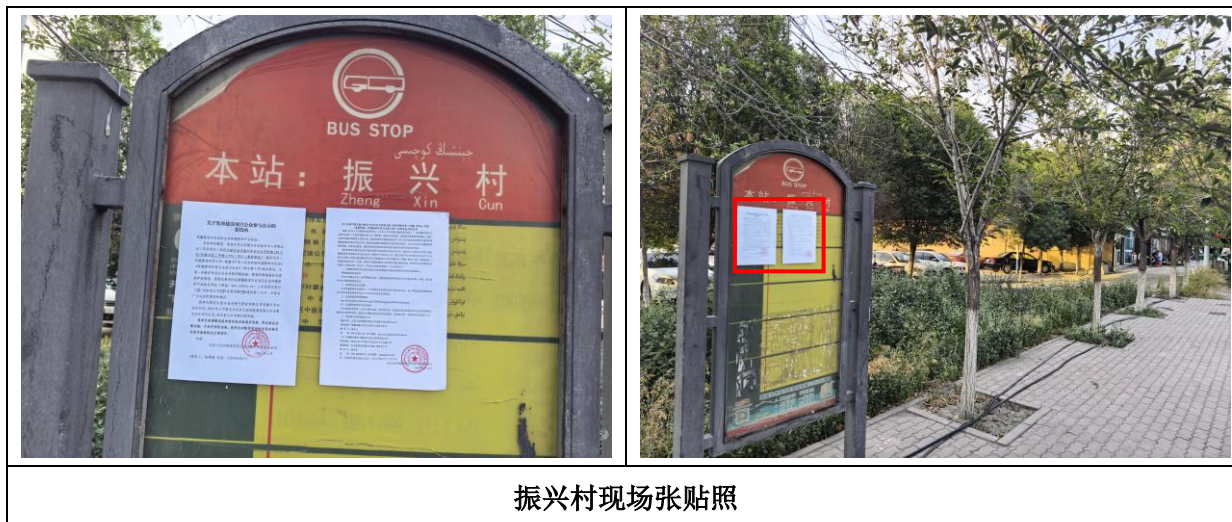
振兴村现场张贴照