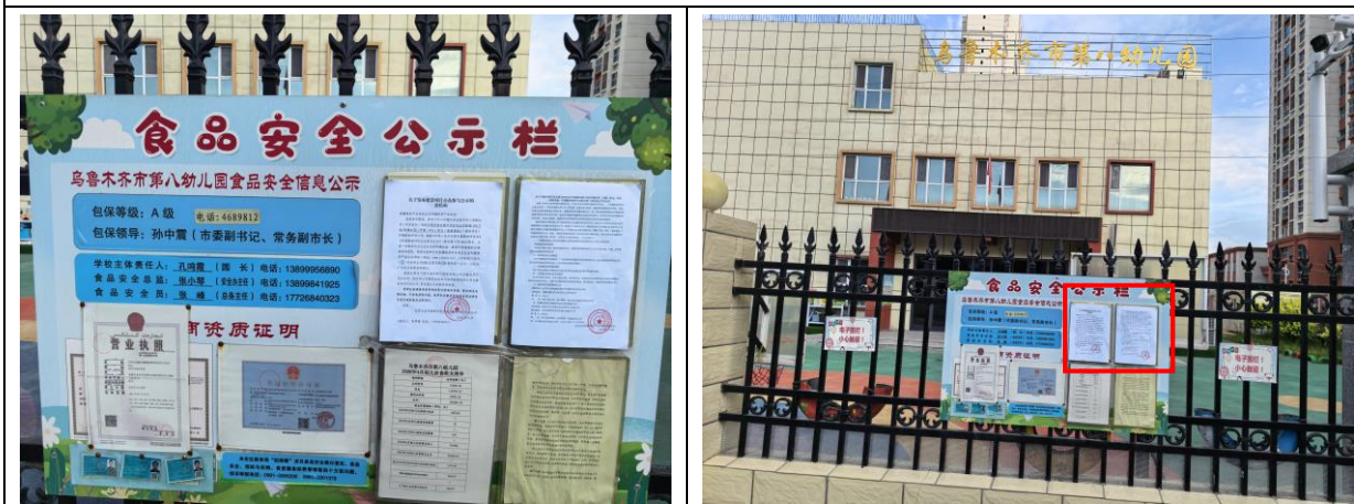
乌鲁木齐市第八幼儿园现场张贴照