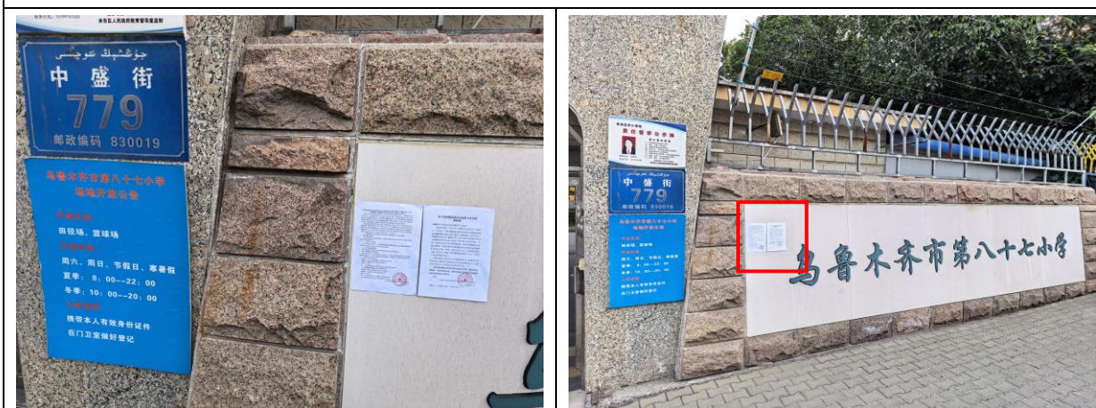
乌鲁木齐市第八十七小学现场张贴照