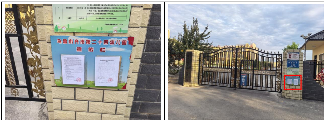
乌鲁木齐市第二十四幼儿园现场张贴照