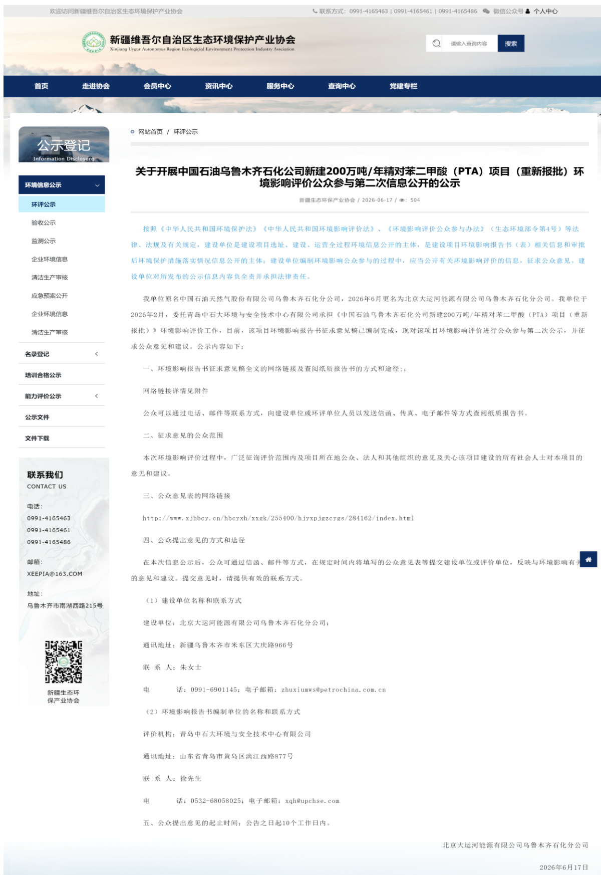
图 3-1 征求意见稿公开新疆维吾尔自治区生态环境保护产业协会网站截图