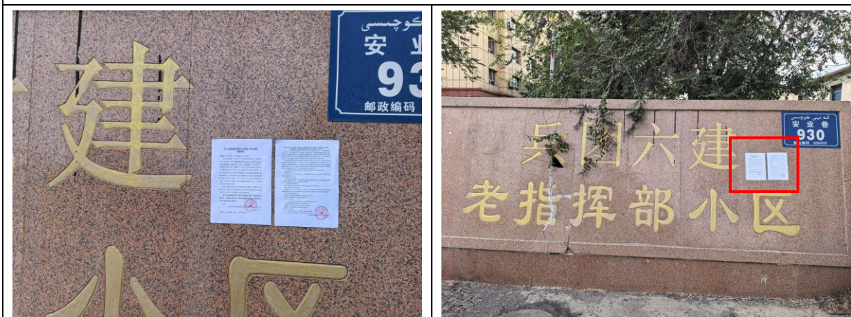
兵团六建老指挥部小区现场张贴照