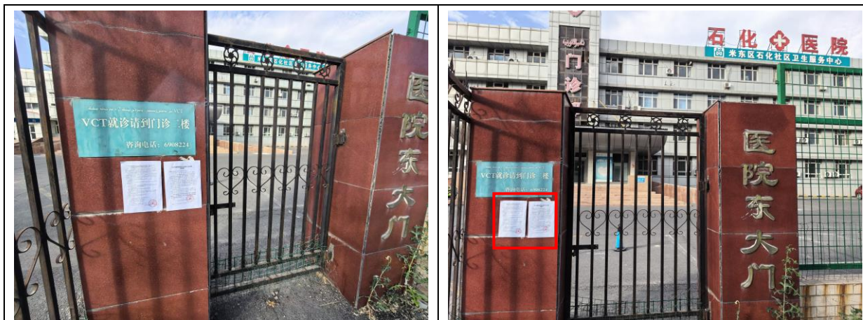
石化医院现场张贴照