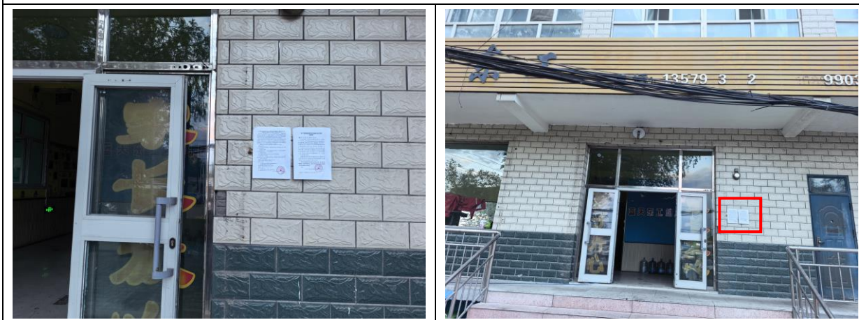
蓝天东工双语幼儿园现场张贴照