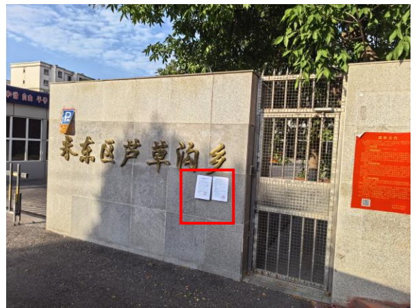
芦草沟乡现场张贴照