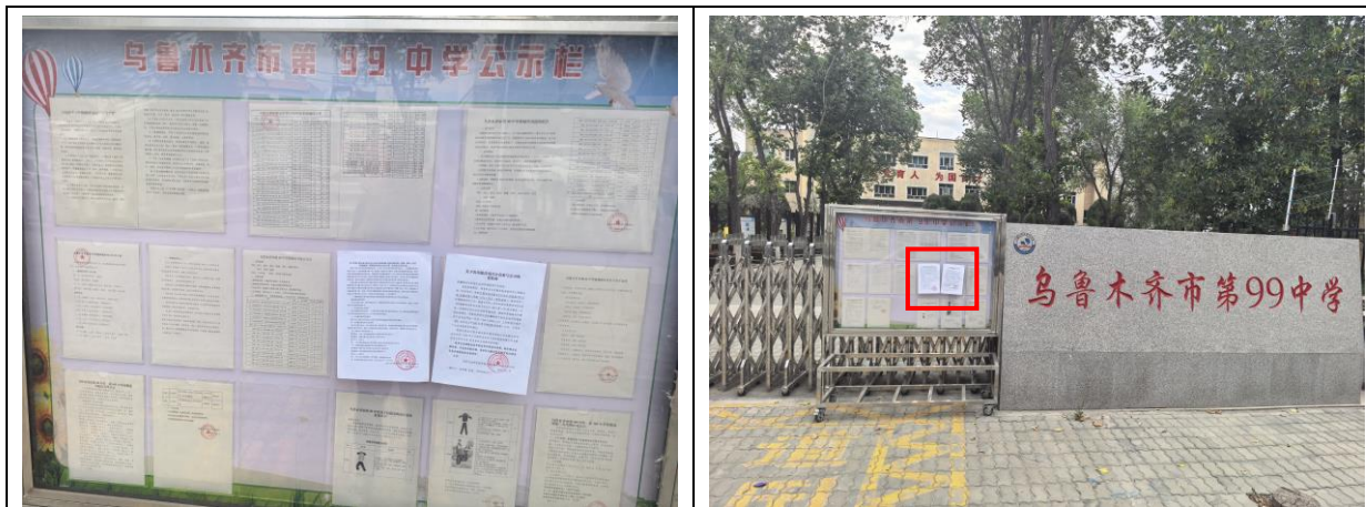
乌鲁木齐市第 99 中学现场张贴照片

按照《环境影响评价公众参与办法》第十一条规定，对环境影响报告书征求意见稿进行公示，于 2026 年 6 月 18 日开始通过在建设项目所在地公众易于知悉的场所张贴公告的方式公开，持续时间不少于 10 工作日，符合《环境影响评价公众参与办法》的要求。现场张贴结果见下图。